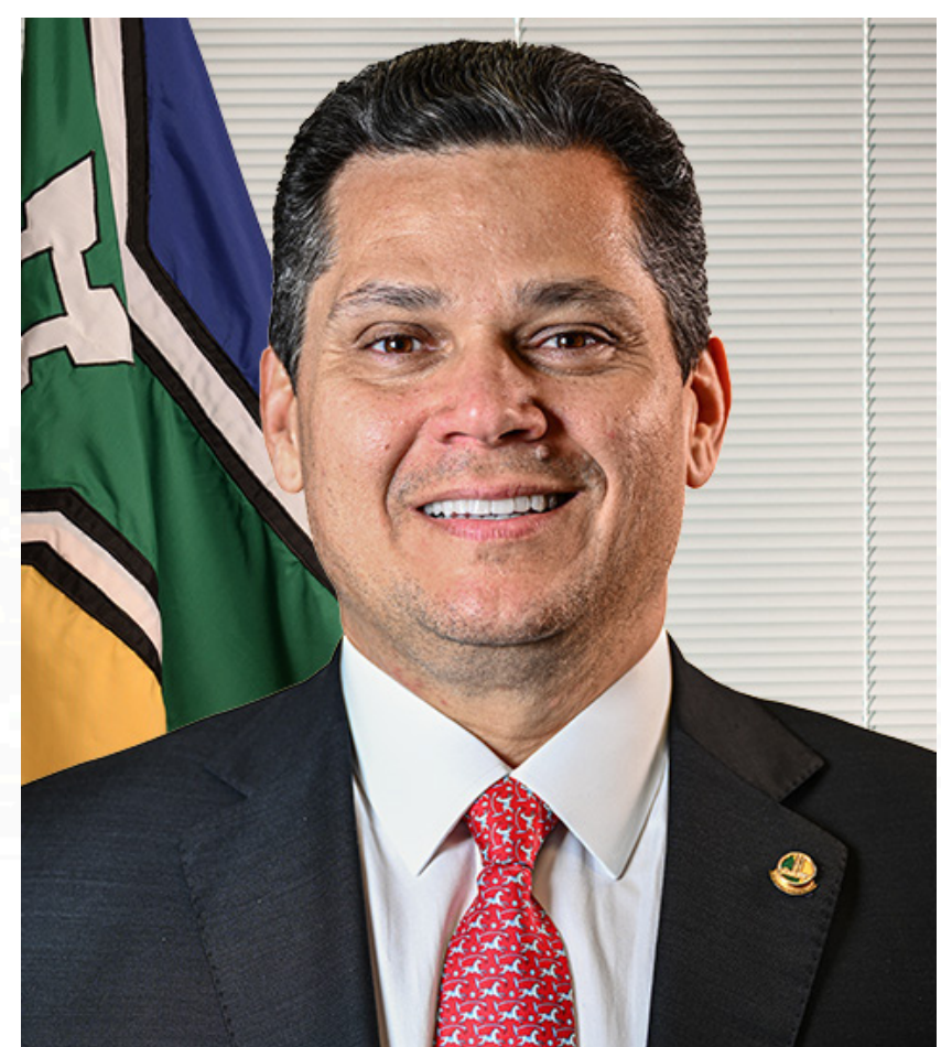
Presidente do Senado Davi Alcolumbre