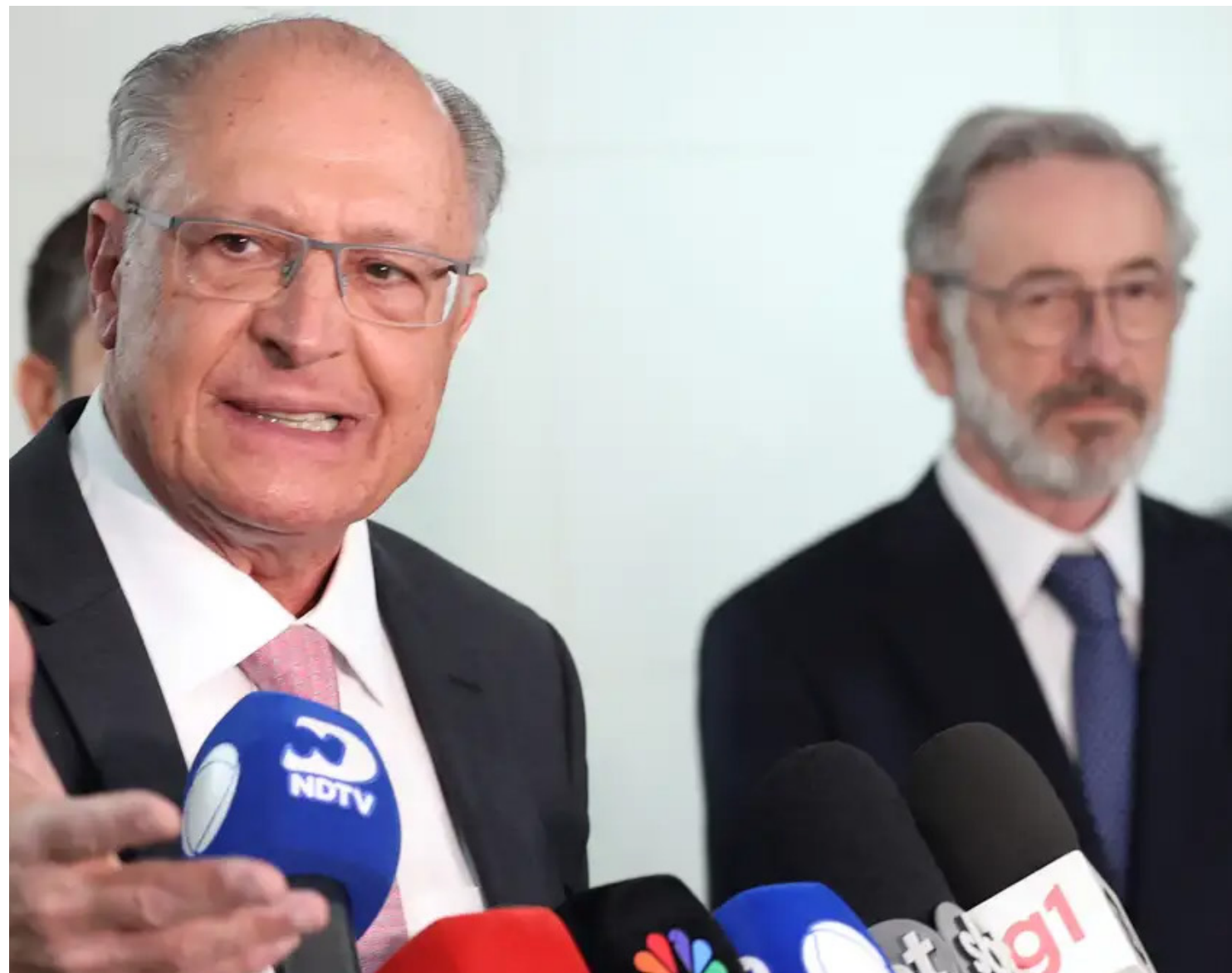
Vice-Presidente Geraldo Alckmin ao lado do Presidente da Caixa Econômica Federal