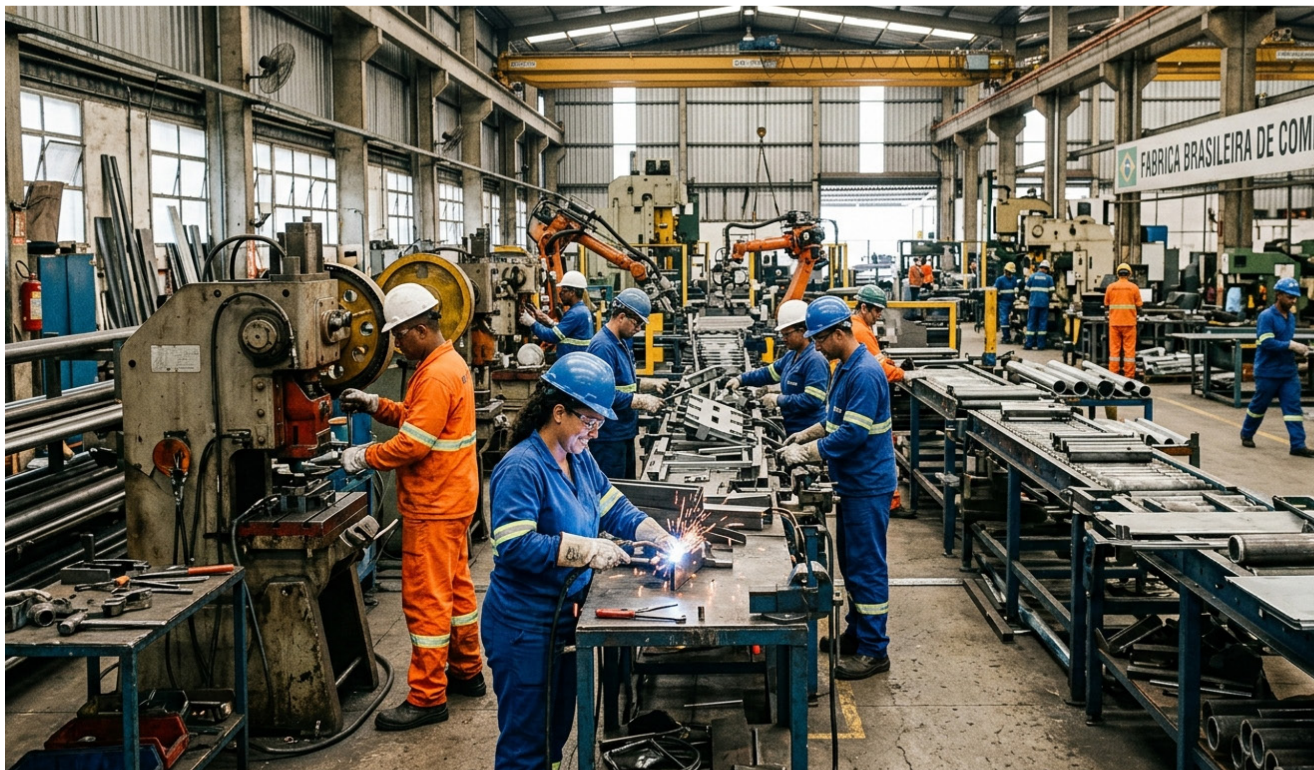
Imagem mostra representação de trabalhadores em uma fábrica

Entidades representativas de diferentes setores produtivos do Brasil divulgaram um manifesto conjunto direcionado ao Senado Federal. O documento é uma carta aberta que solicita a aprovação da Proposta de Emenda à Constituição número 12 de 2026, apelidada de PEC do Trabalho Flexível. A iniciativa surge como um contraponto direto à proposta que extingue a escala de trabalho de seis dias por um de descanso, a chamada PEC do fim da escala 6x1.