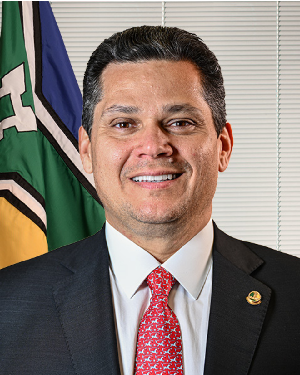
Presidente do Senado Davi Alcolumbre