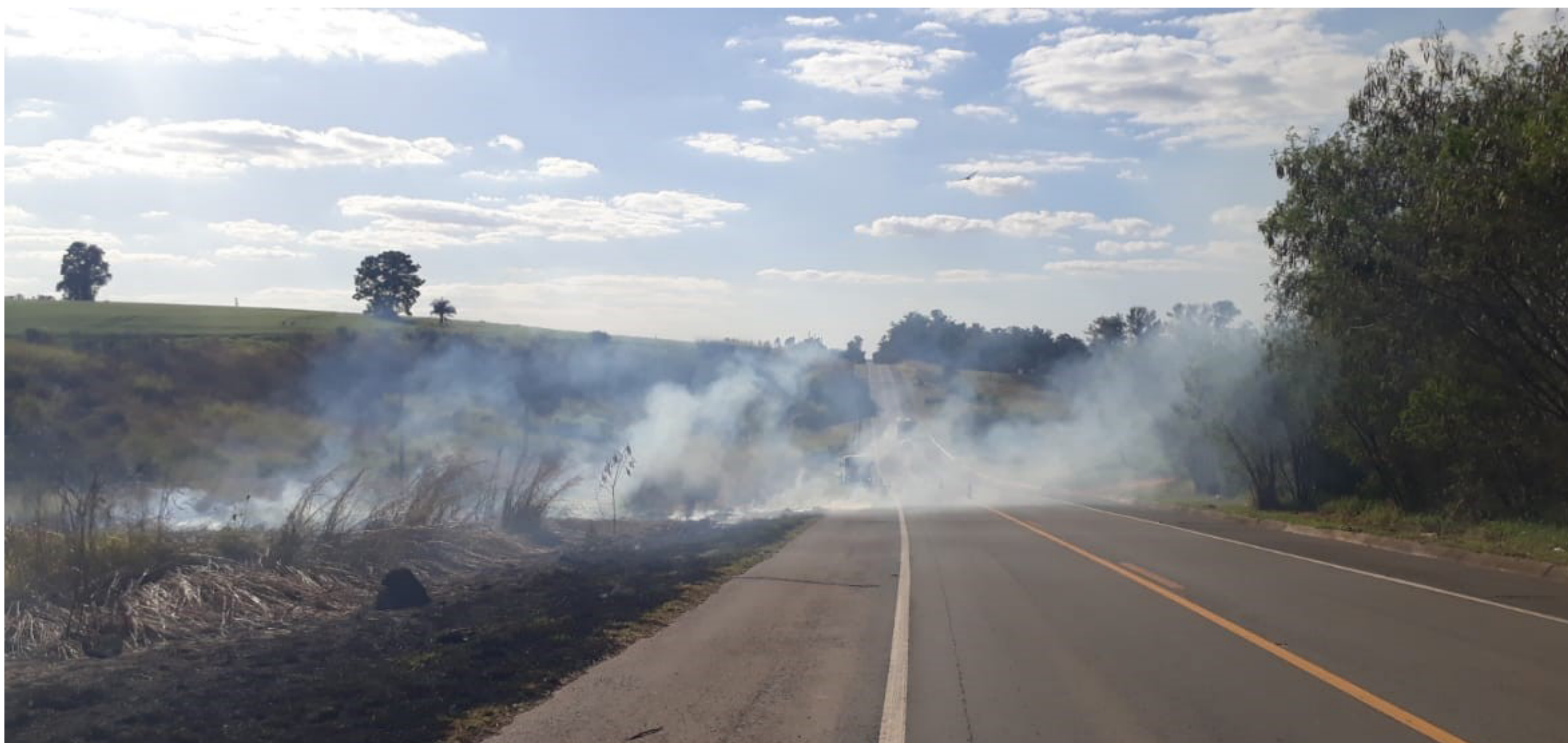
Imagem representa incêndio em rodovia