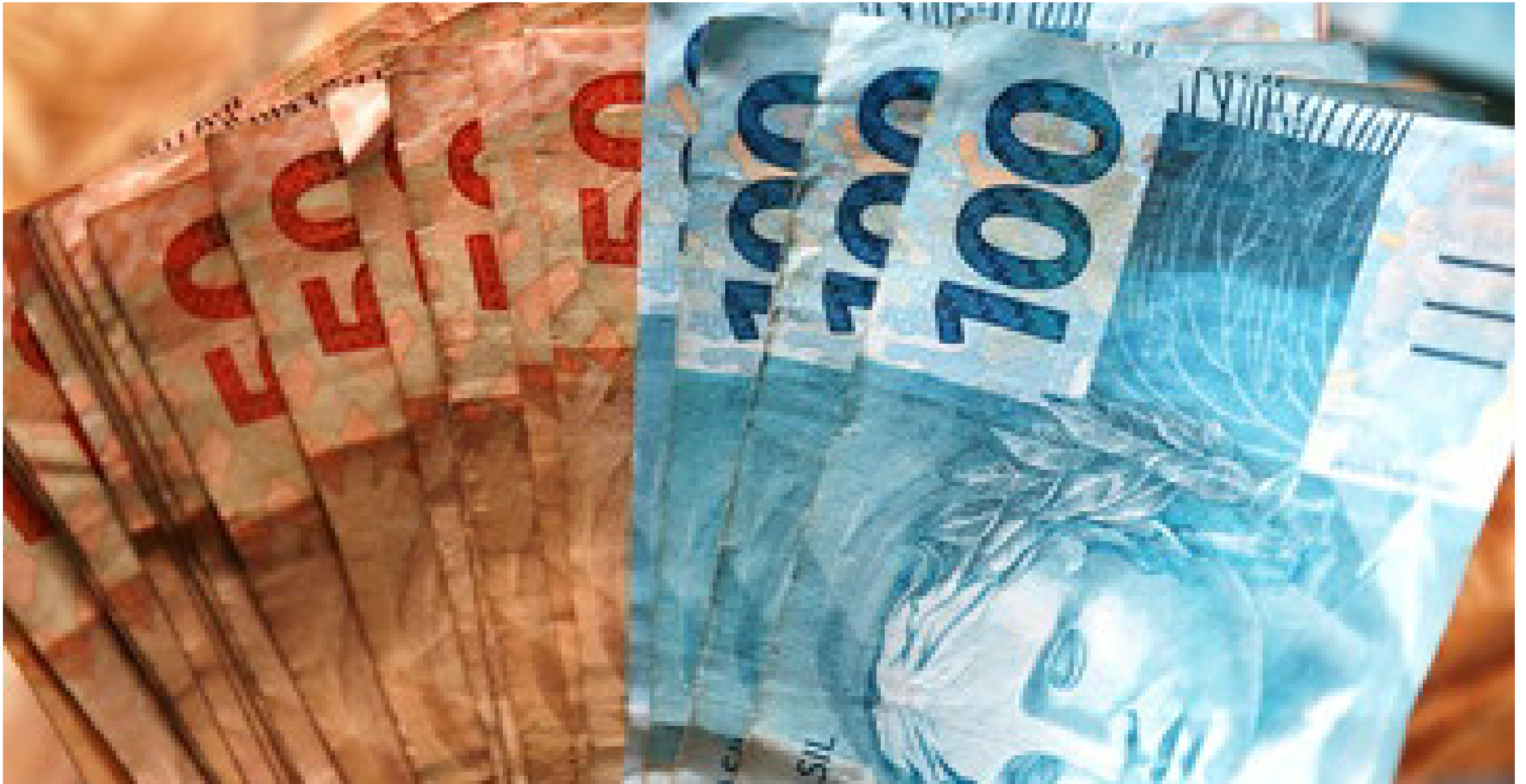
Imagem mostra cédulas de R$ 50,00 e R$ 100,00

Por Guilherme Kalel: Jornalista e Editor