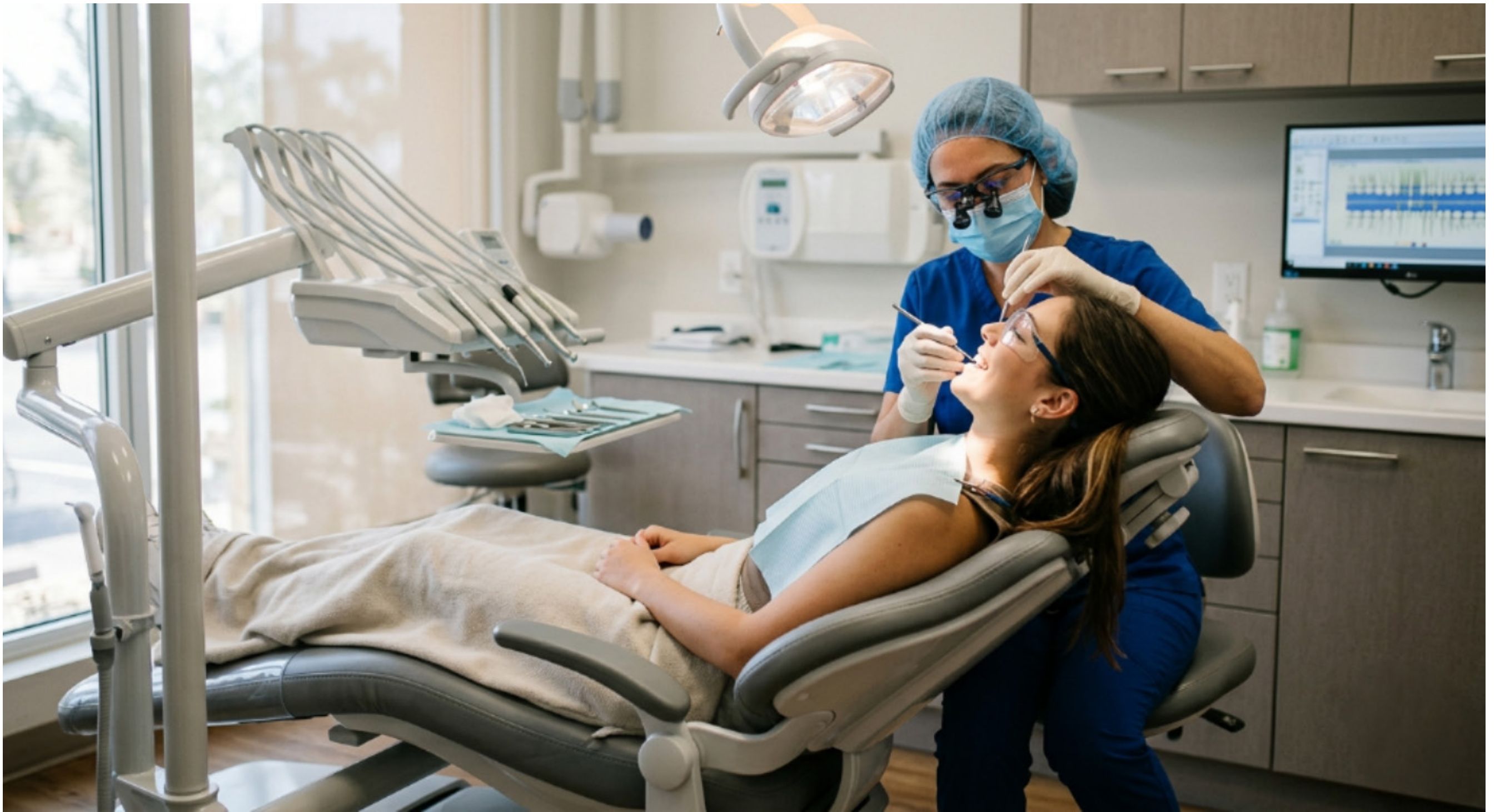
Imagem mostra representação de uma pessoa em uma cadeira de dentista