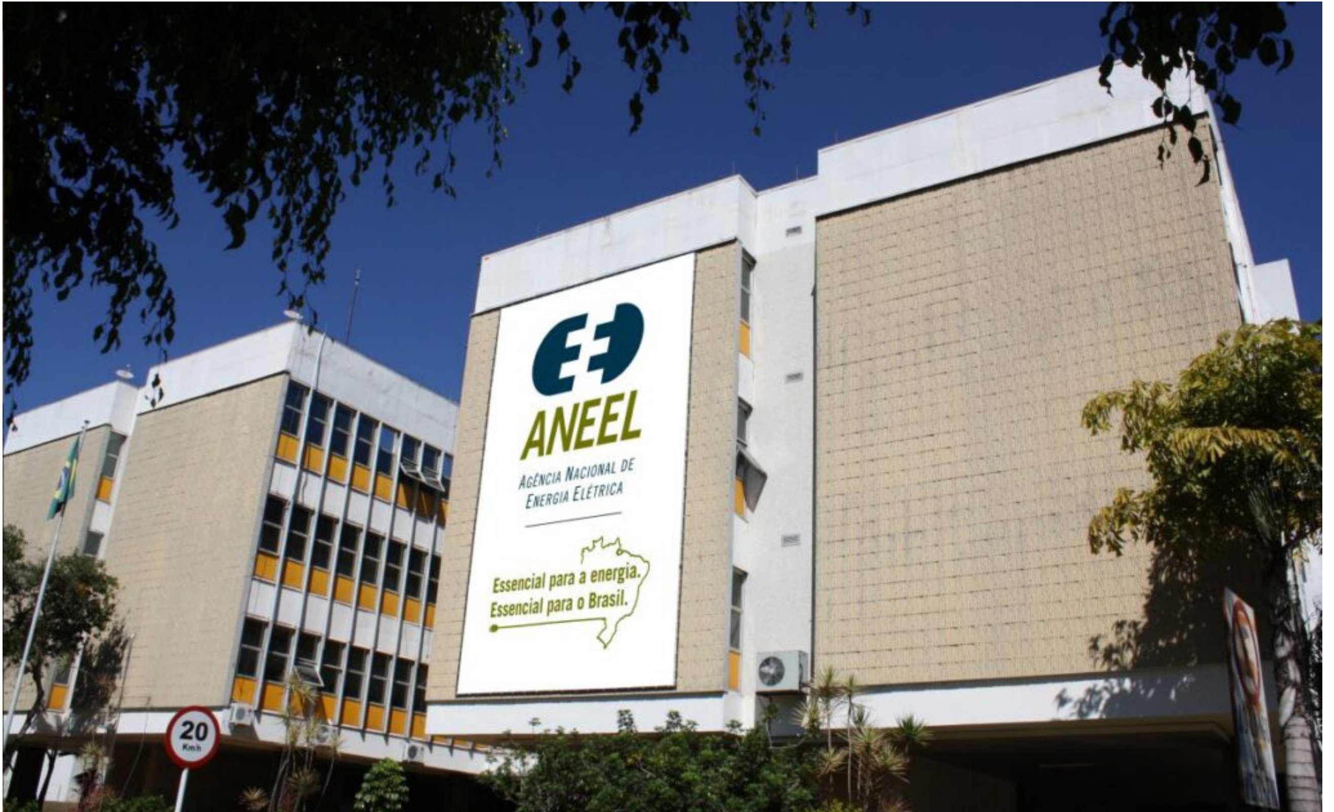
Imagem mostra fachada da Aneel

A Agência Nacional de Energia Elétrica, Aneel, revisou para cima as suas projeções para o comportamento das tarifas de energia no País. De acordo com os novos dados divulgados pelo órgão regulador, a estimativa média de aumento para as contas de luz em 2026 subiu para 8,6%. Esse percentual representa um impacto real no bolso dos cidadãos, uma vez que se posiciona consideravelmente acima da inflação oficial projetada para o período.