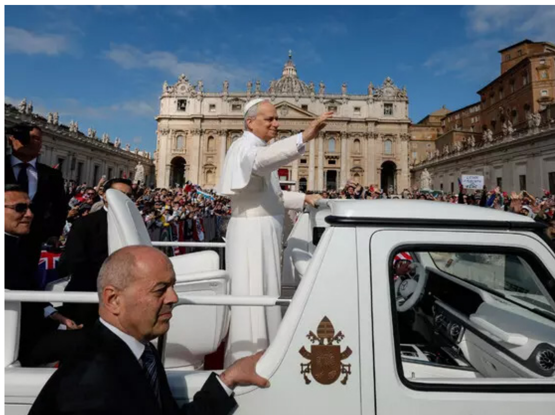
Papa Leão XIV em aparição na Praça de São Pedro

O Vaticano emitiu um alerta rigoroso contra a Fraternidade São Pio X, um grupo católico dissidente conhecido por suas posições ultraconservadoras. A Santa Sé ameaçou aplicar a pena de excomunhão caso a organização prossiga com o plano de ordenar 9 bispos sem a devida autorização do papa Leão XIV. Esta é a primeira vez que o atual pontífice utiliza a ameaça da punição mais severa da Igreja para conter um possível movimento de ruptura que desafia a unidade católica.