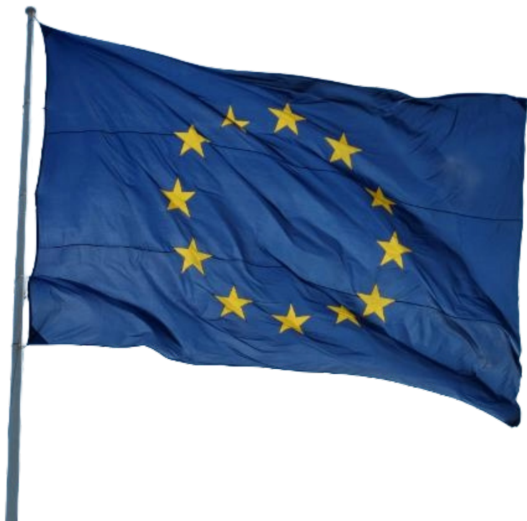
Imagem mostra bandeira da União Europeia