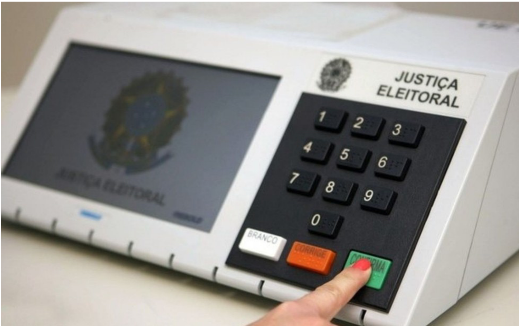
Imagem mostra urna eletrônica usada em eleições no Brasil