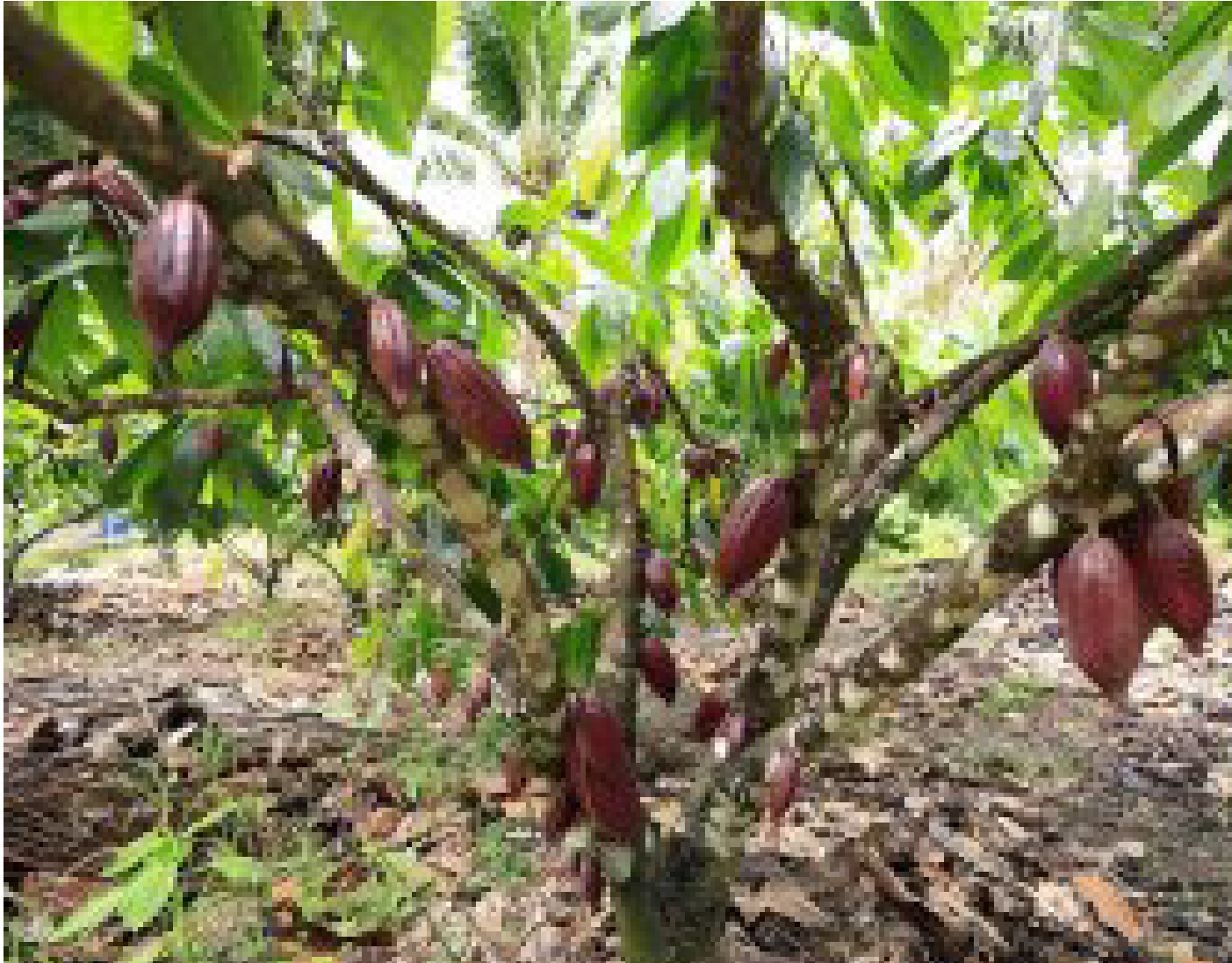
Imagem mostra uma plantação de cacau, principal composição para fabricação de chocolates

O presidente Luiz Inácio Lula da Silva sancionou uma nova legislação que altera profundamente as regras de fabricação e comercialização de derivados de cacau no país. A partir de agora, para que um produto receba a denominação de chocolate no rótulo, ele precisará conter, no mínimo, 35% de sólidos totais de cacau em sua composição.