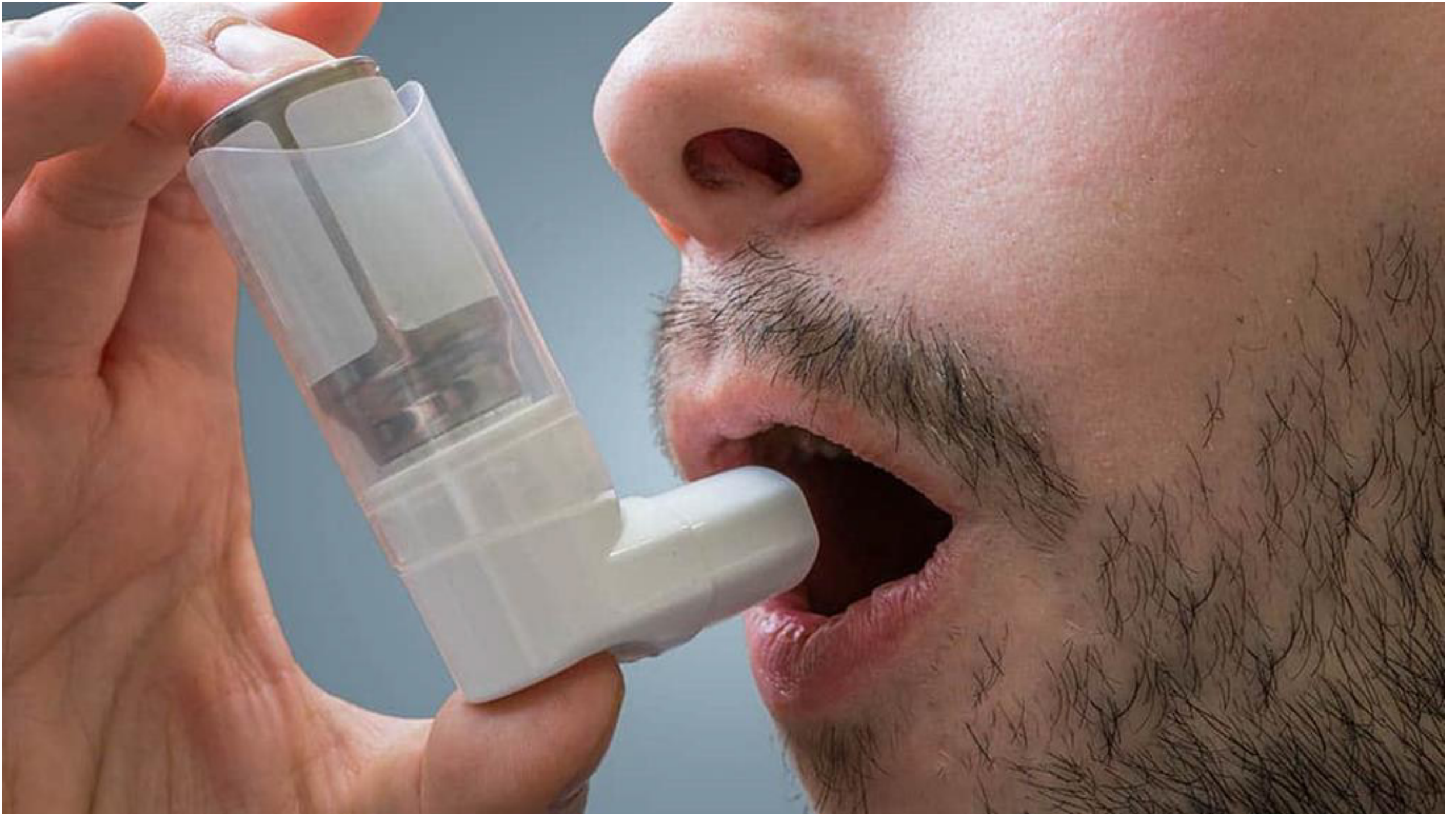
Imagem mostra paciente com doença pulmonar no uso de um inalador

A Agência Nacional de Vigilância Sanitária (Anvisa), aprovou recentemente uma nova indicação para o medicamento Nucala, cujo princípio ativo é o mepolizumabe, voltado ao tratamento da doença pulmonar obstrutiva crônica. A decisão marca um avanço importante para pacientes que sofrem com essa condição respiratória grave e persistente.