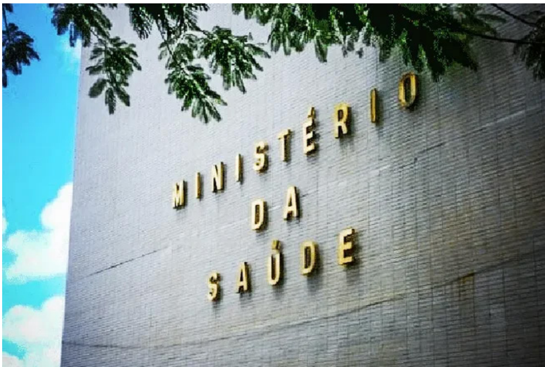
Imagem mostra prédio do Ministério da Saúde

O Ministério da Saúde oficializou o repasse de R$ 1,2 bilhão destinados à construção de 541 novas Unidades Básicas de Saúde (UBS) em todo o território nacional. A iniciativa contempla 505 municípios brasileiros e faz parte de uma estratégia de expansão e fortalecimento da Atenção Primária no Sistema Único de Saúde (SUS).