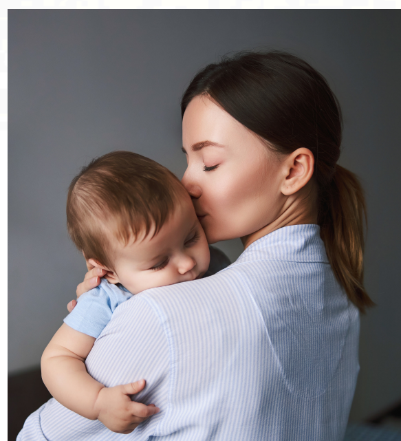
Mãe segura um bebê nos braços em simbolismo ao mês das mães