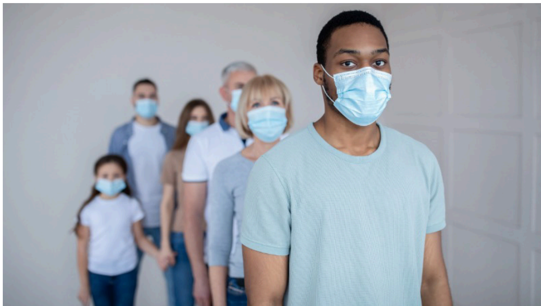
Foto / Reprodução - Imagem mostra pessoas com máscaras de proteção a doenças respiratórias