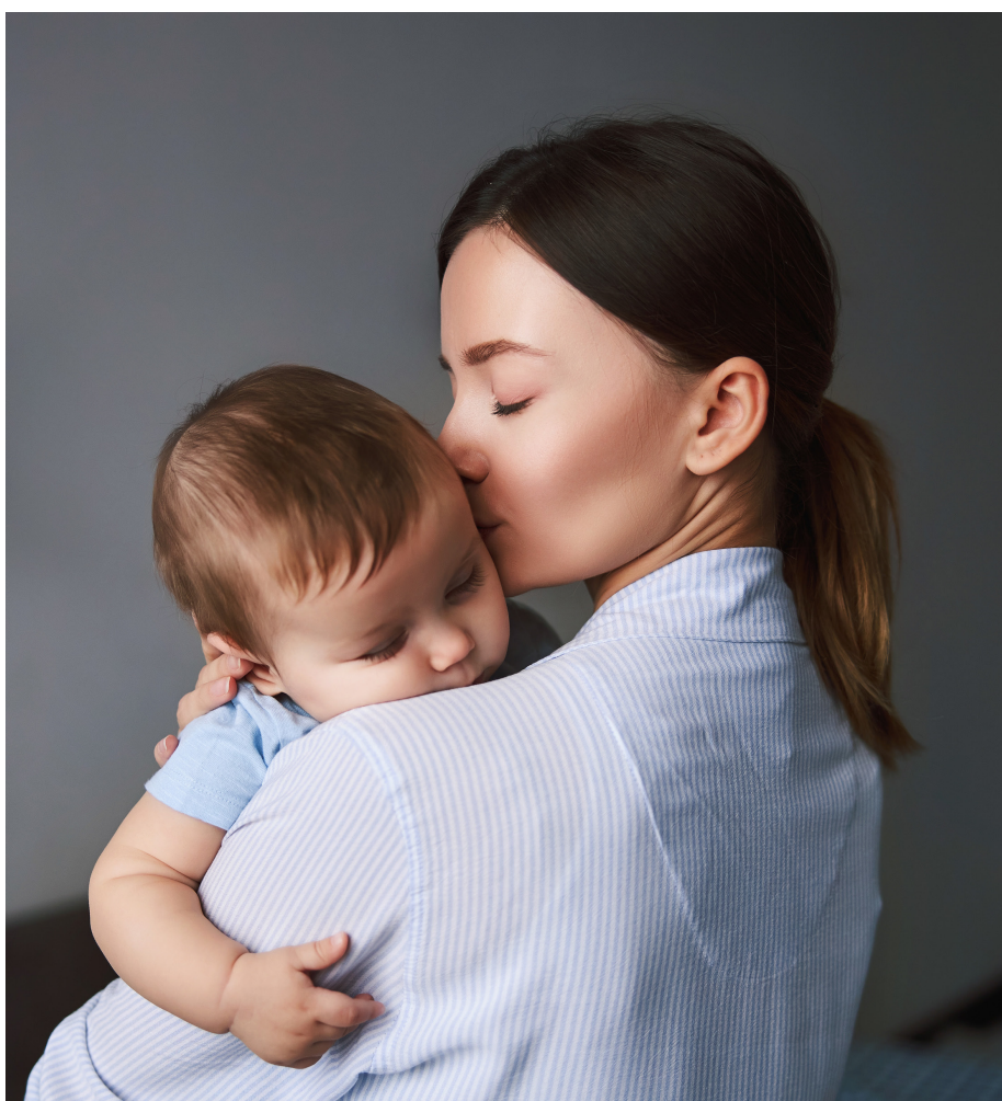
Foto / Reprodução - Mãe segura um bebê nos braços em simbolismo ao mês das mães