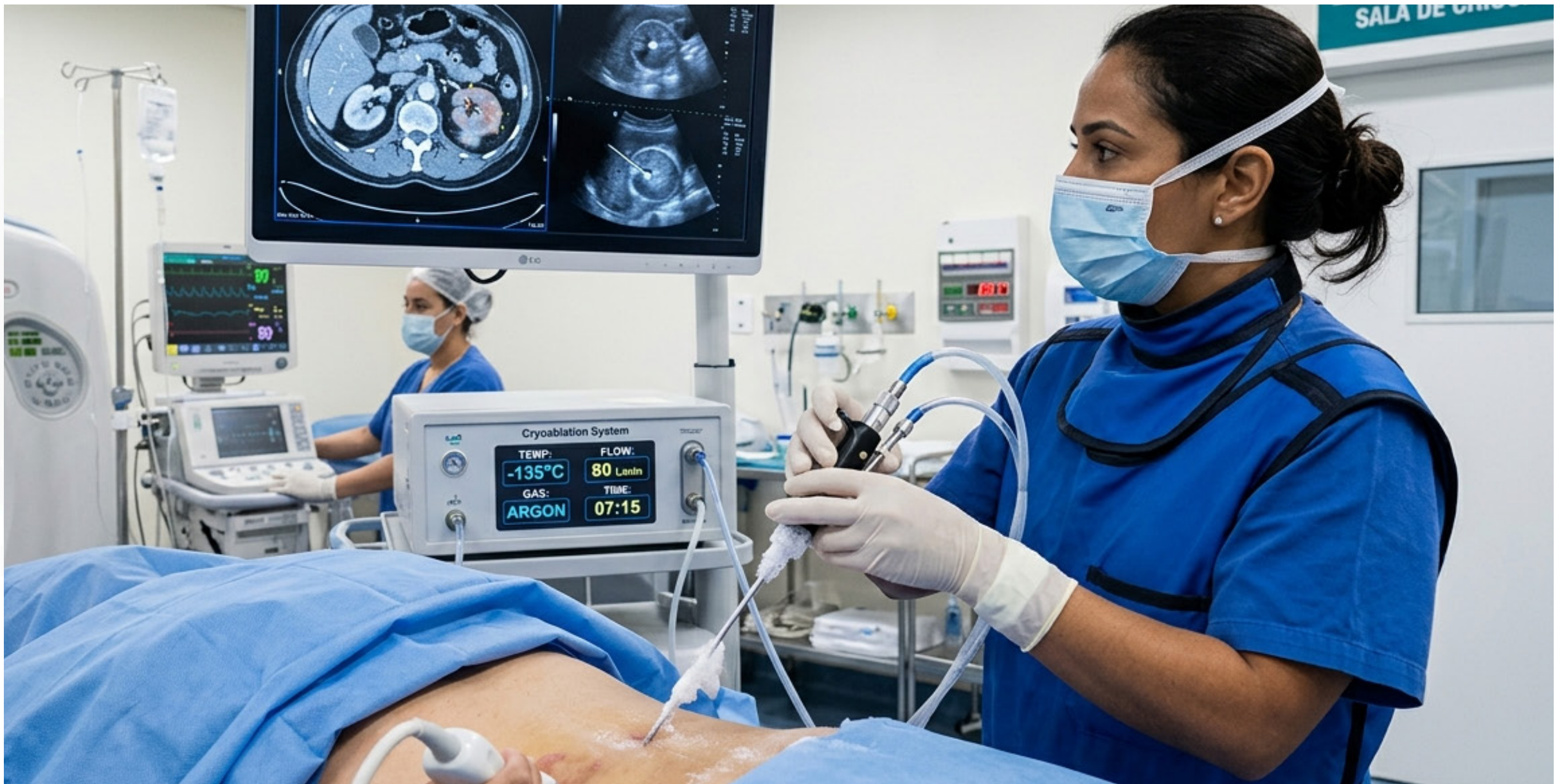
Paciente passa por procedimento de crioablação