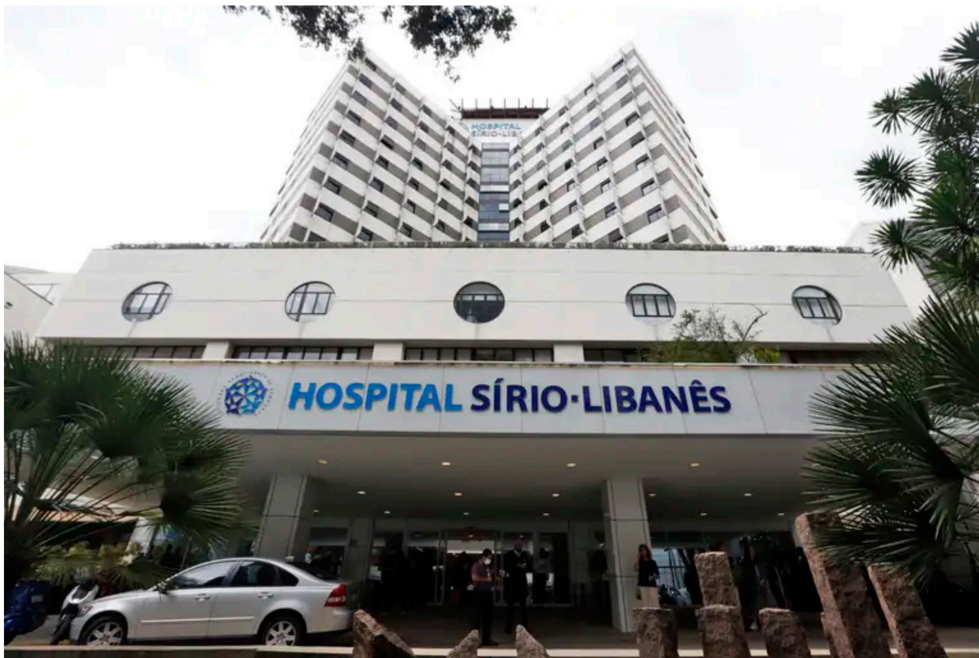
Imagem mostra fachada de uma unidade do Hospital Sírio-Libanês