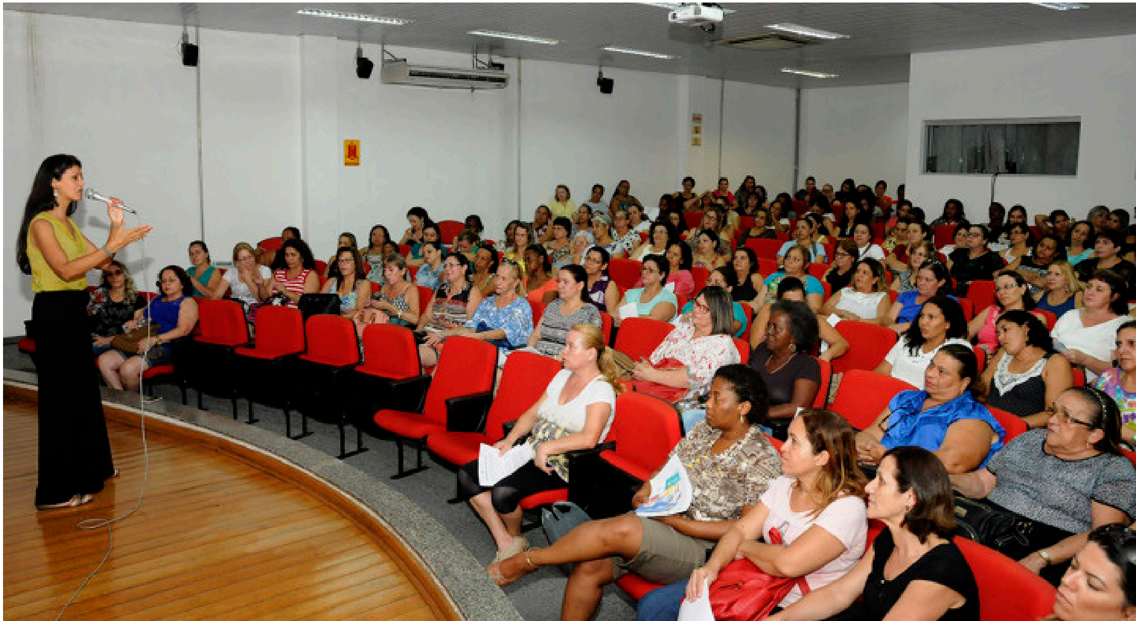
Imagem mostra representação de mulheres em um ambiente de palestra e liderança

O dia 8 de março não é apenas uma data no calendário para a entrega de flores ou mensagens gentis. O Dia Internacional da Mulher é, fundamentalmente, um marco de resistência, uma pausa para reflexão e um reconhecimento necessário da força motriz que sustenta a estrutura da nossa sociedade.