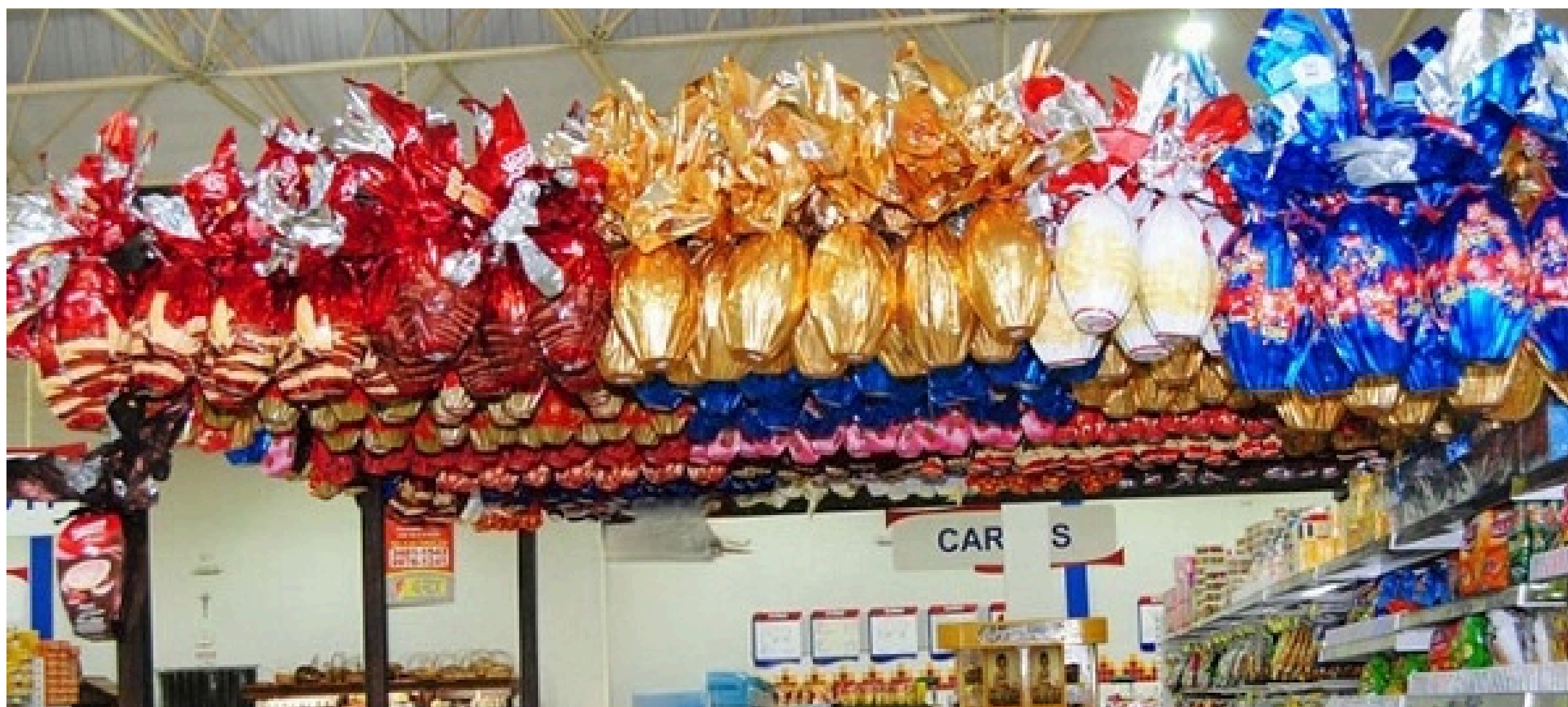
Supermercado exhibe ovos de páscoa