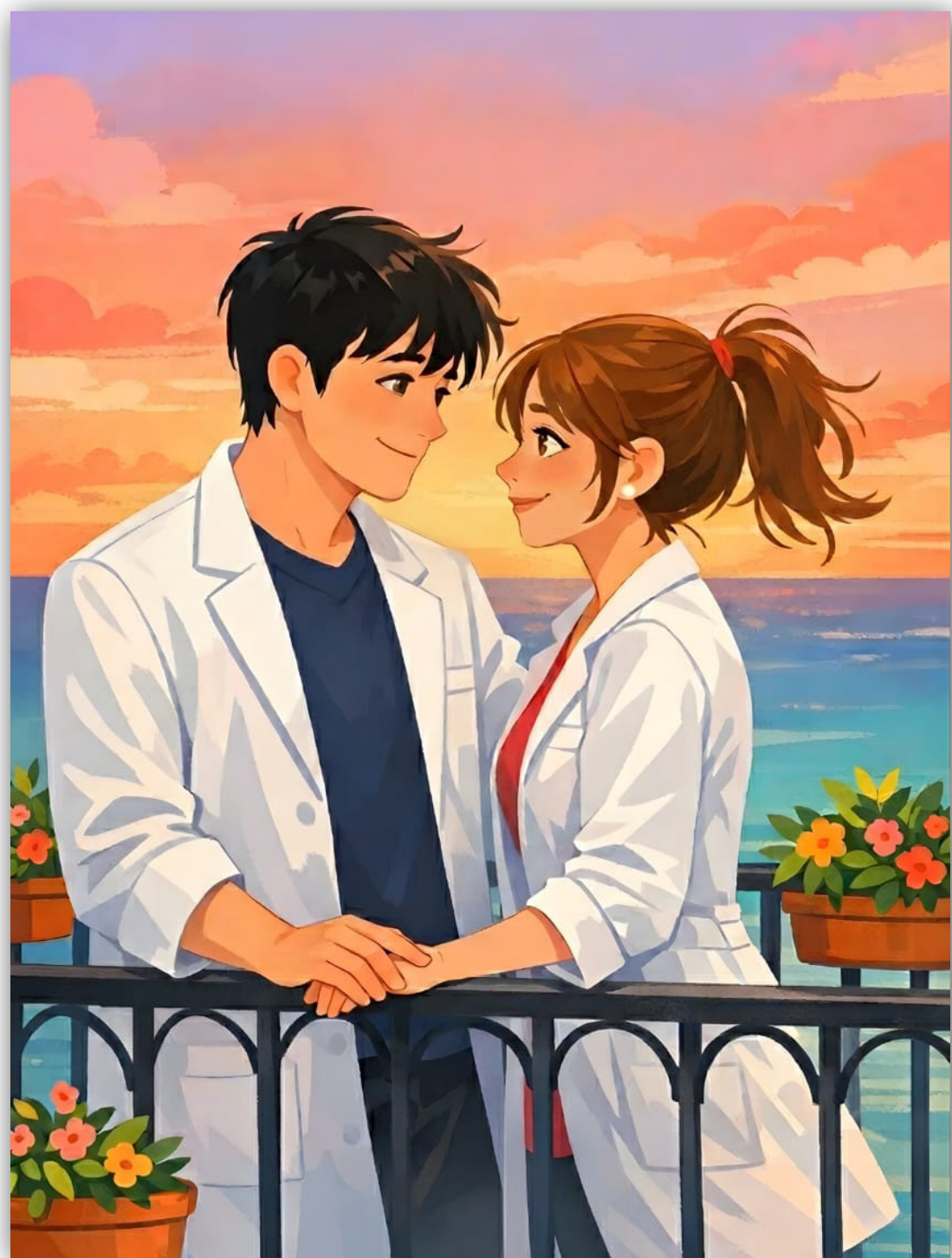
Imagem mostra ilustração de Mikhail e Melissa, protagonistas de livro "Meu Perfeito Amor"

Enquanto o Rei segue a linhagem da família Real, e funciona como uma figura de representação, o Primeiro-Ministro é eleito pelo voto popular.