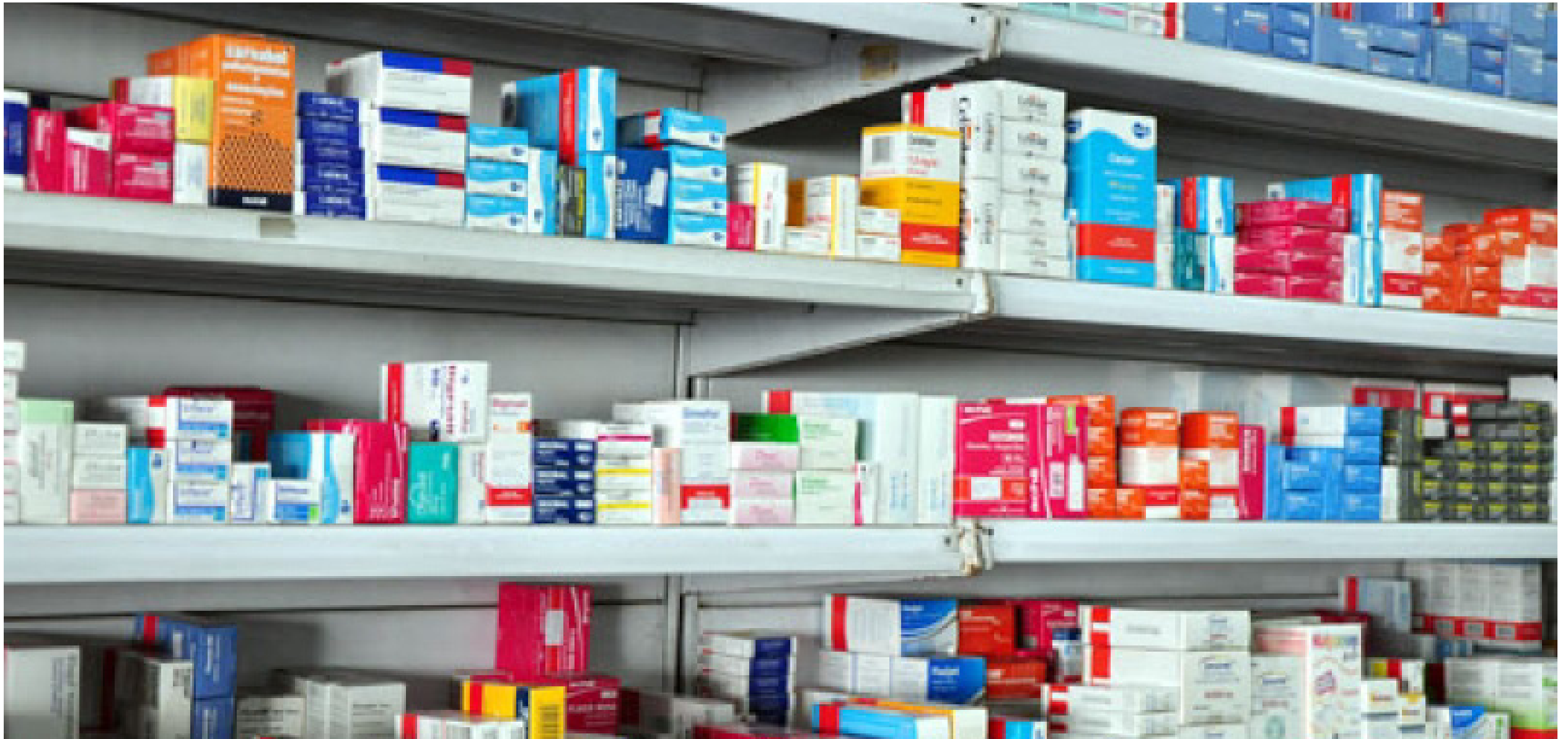
Imagem mostra prateleiras de remédios

O Congresso Nacional aprovou um projeto de lei que permite a venda de medicamentos em supermercados de todo o Brasil.