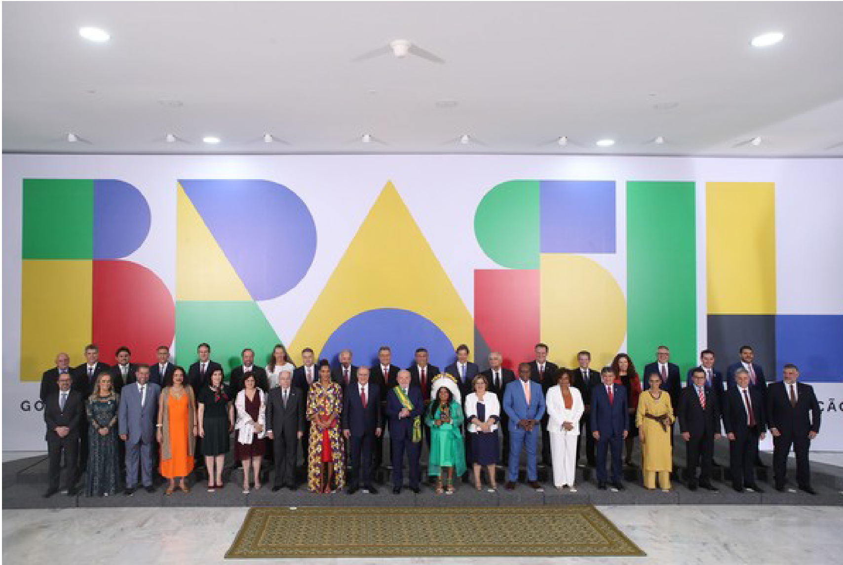
Imagem mostra Presidente Lula com Ministros de Estado em dia de posse Presidencial em janeiro de 2023