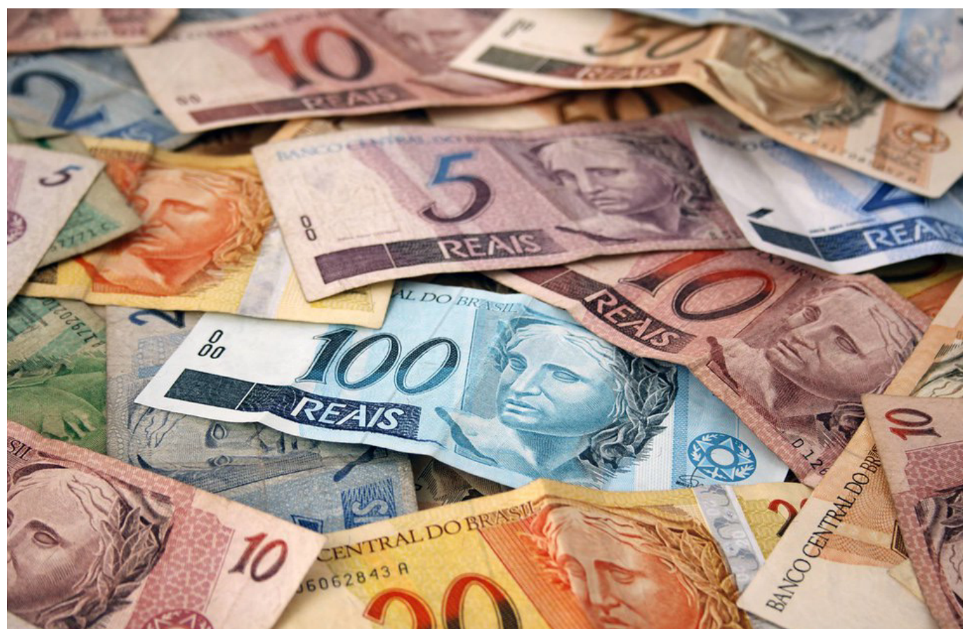
Imagem mostra cédulas de dinheiro

Ao todo no acumulado o PIB do Brasil em 2025 foi de R$ 13,7 trilhões.