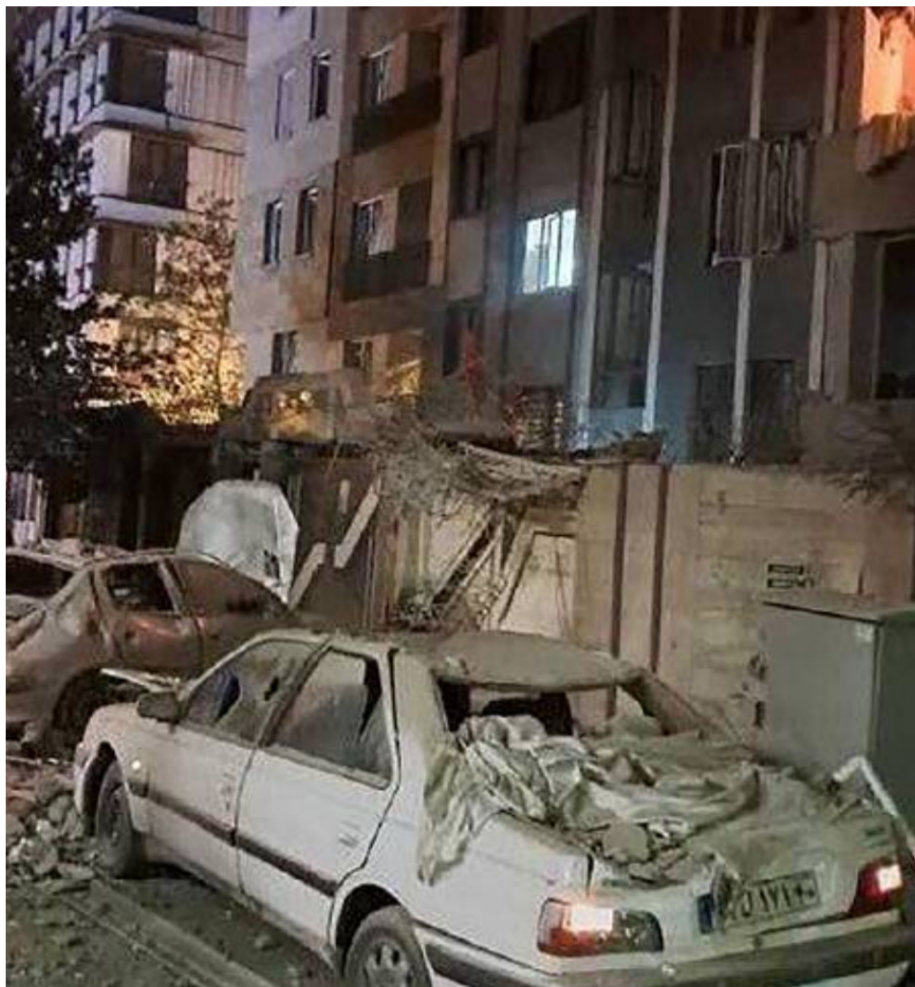
Imagem mostra Teerã, capital do Irã após um dos ataques de Estados Unidos e Israel

A escalada de tensões no Oriente Médio atingiu um ponto de ruptura no dia 28 de fevereiro de 2026, com o início de uma ofensiva militar de larga escala liderada pelos Estados Unidos e Israel contra o Irã. Denominada Operação Epic Fury (Fúria Épica) pelos americanos e Operação Rugido do Leão pelos israelenses, a ação marcou o início de um conflito que já redesenha a geopolítica global.