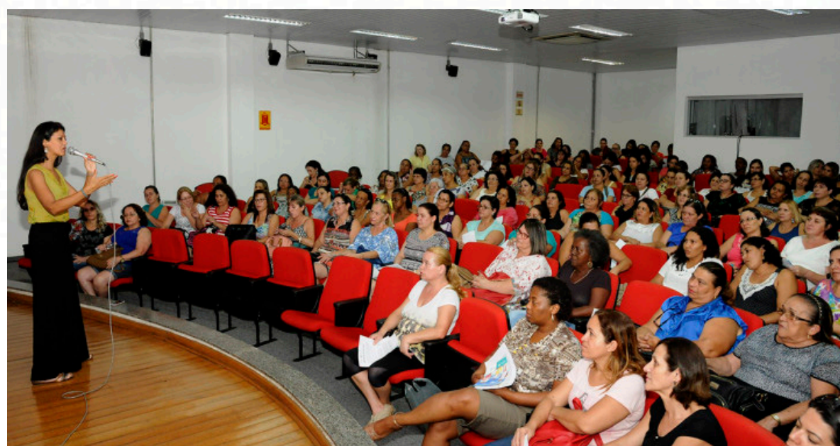
Imagem mostra representação de mulheres em um ambiente de palestra e liderança