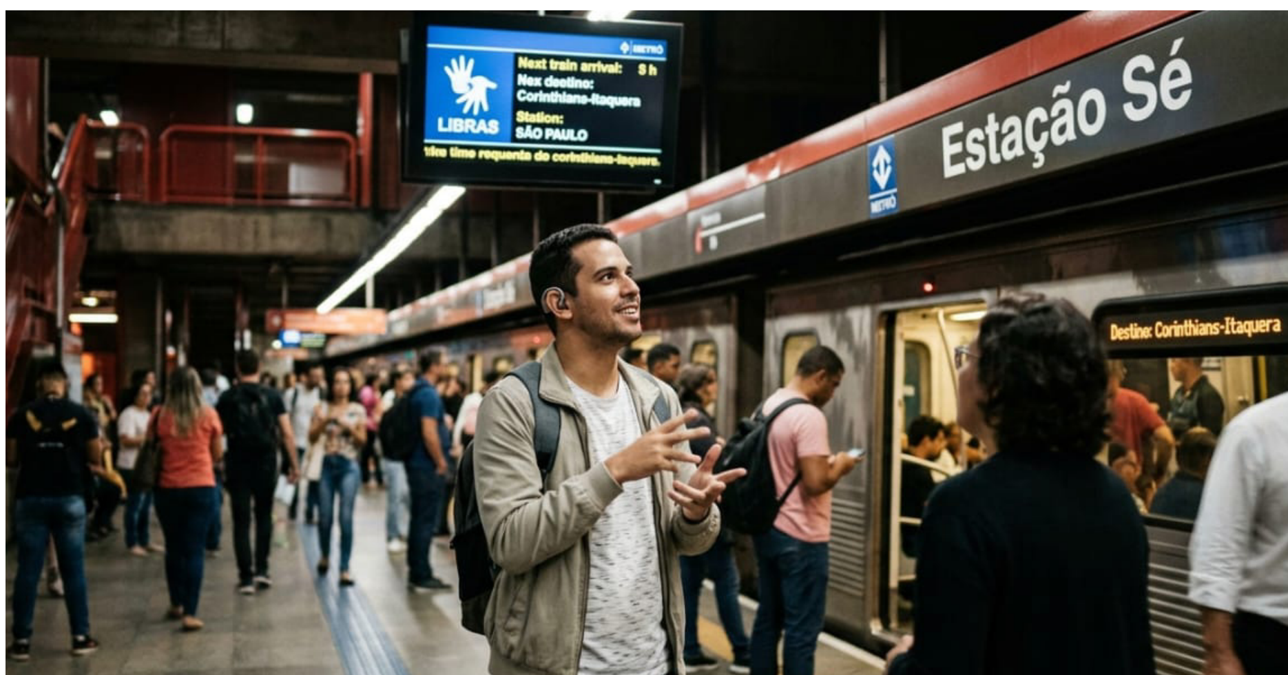
Pessoa com deficiência auditiva em estação de Metrô de São Paulo

Os passageiros com deficiência auditiva que utilizam o Metrô de São Paulo passaram a contar, desde a quarta-feira, 18, com um novo recurso de acessibilidade para facilitar o atendimento nas estações: videochamadas ao vivo, gratuitas, com intérpretes do programa São Paulo São Libras , do Governo de São Paulo, lançado em 2023 que garante a pessoas surdas autonomia e tranquilidade em serviços públicos estaduais. A iniciativa é uma parceria entre o Metrô de São Paulo e a Secretaria dos Direitos da Pessoa com Deficiência (SEDPCD).