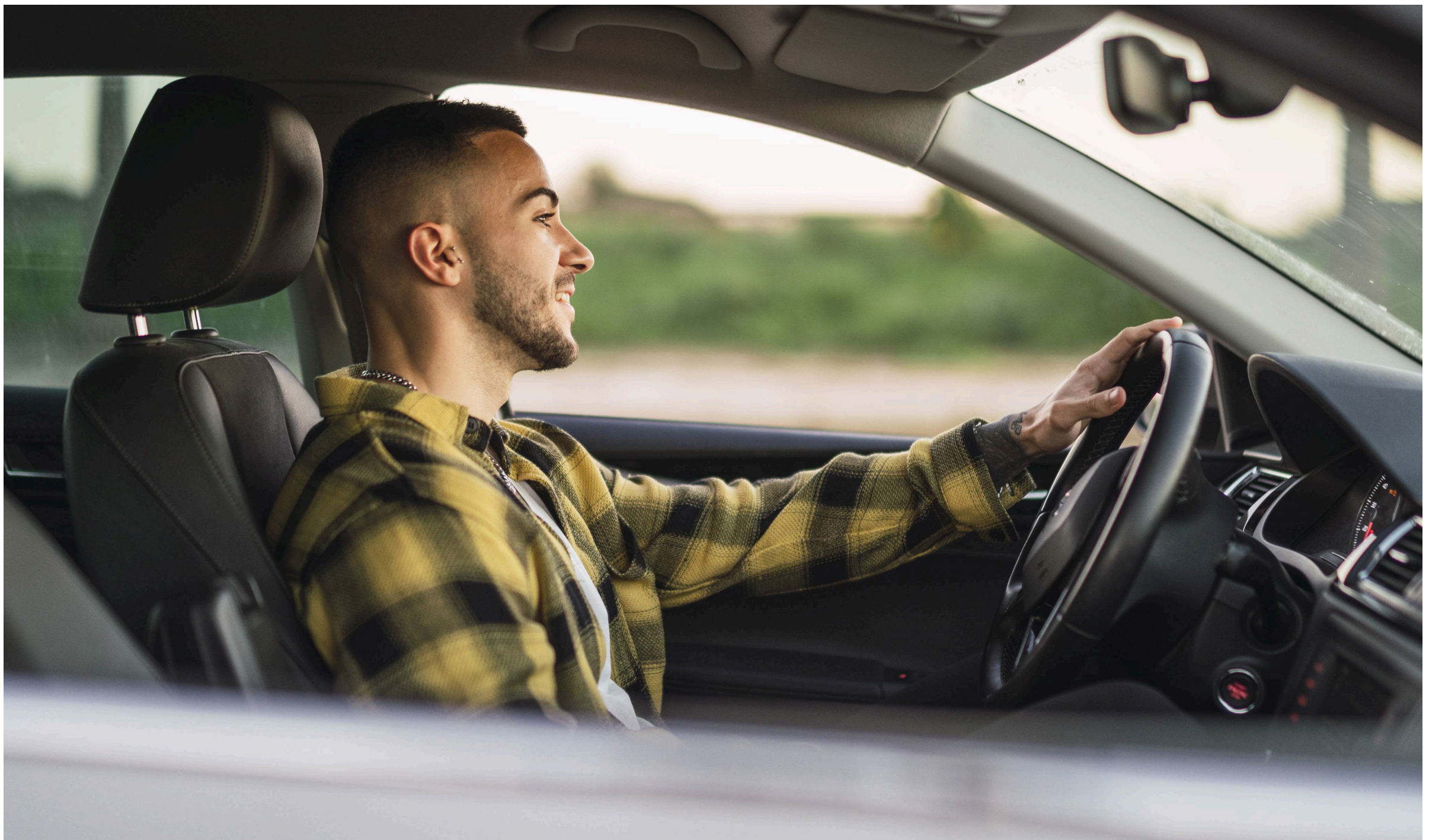
Foto / Reprodução - Imagem mostra um jovem na direção de um veículo

Mais de 584 mil brasileiros já emitiram a Carteira Nacional de Habilitação (CNH) por meio da CNH do Brasil desde 9 de dezembro de 2025, segundo dados da Secretaria Nacional de Trânsito (Senatran). O número inclui candidatos que iniciaram o processo antes do lançamento da plataforma, mas concluíram as etapas já dentro do novo modelo digital. O formato tem simplificado o acesso ao documento e reduzido o tempo de formação.