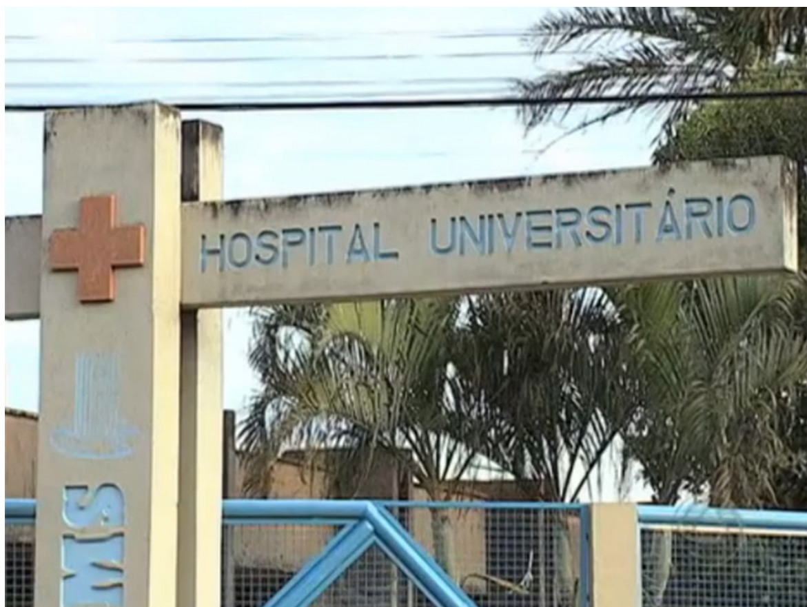
Fachada do Hospital Universitário de Campo Grande

O Hospital Universitário Maria Aparecida Pedrossian (Humap -UFMS/Ebserh) realizou um procedimento de alta complexidade com o apoio do Ecocardiograma Transesofágico Intraoperatório, aliado à atuação integrada do chamado Heart Team. A abordagem foi fundamental no tratamento de uma fístula intracardíaca aorto-cavitária — condição rara e potencialmente grave. O procedimento ocorreu na última terça-feira (17).