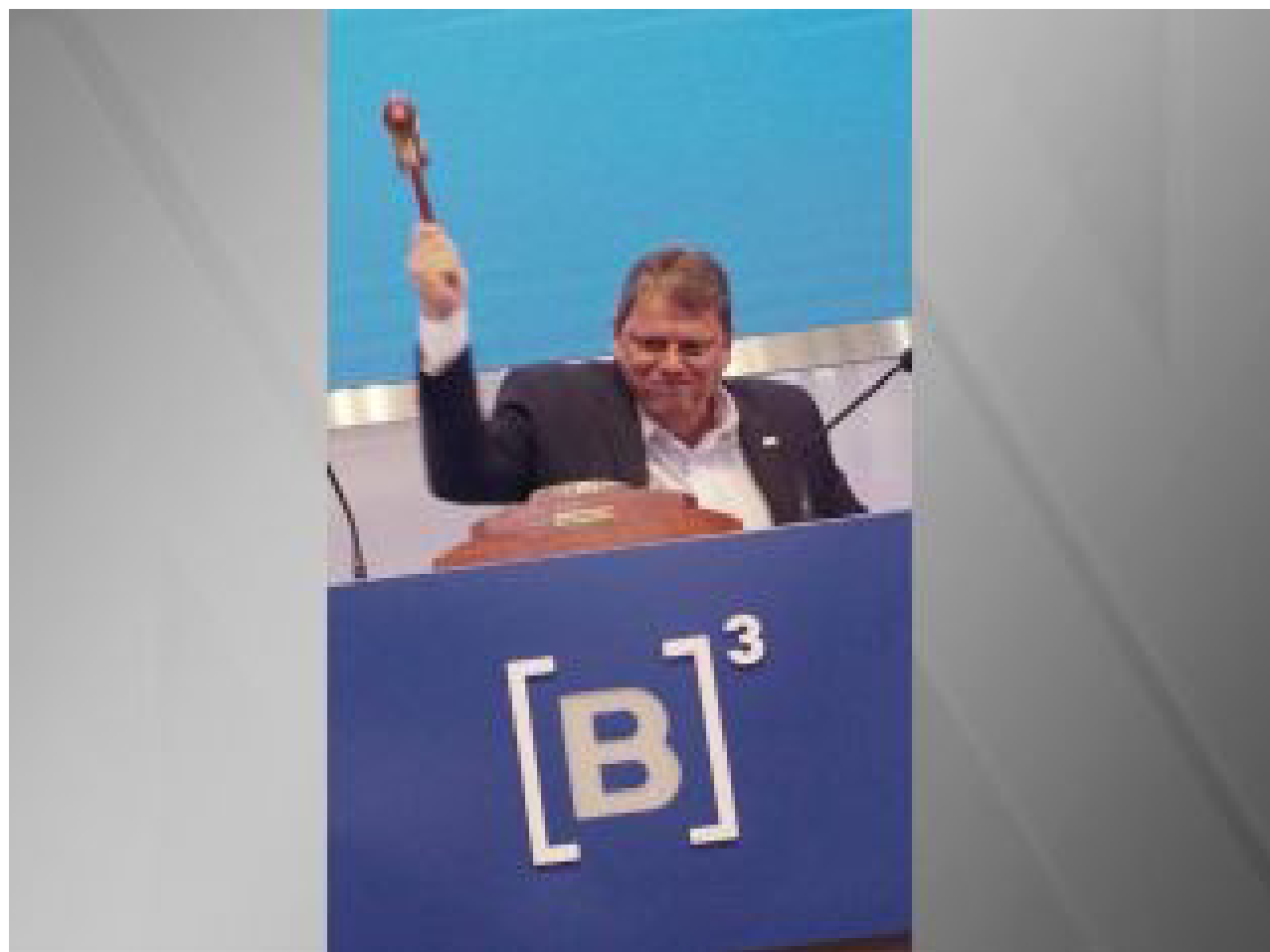
Governador de São Paulo Tarcísio de Freitas bate martelo em leilão da B3 para concessão da construção do novo Centro Administrativo

O Governo de São Paulo realizou na quinta-feira, 26 de fevereiro, na sede da Bolsa de Valores (B3), o leilão da parceria público-privada do Novo Centro Administrativo. O vencedor foi o consórcio MEZ-RZK Novo Centro, que apresentou proposta de 9,62% de desconto sobre a contraprestação pública mensal máxima, fixada em R$ 76,6 milhões. O outro proponente, o Consórcio Acciona-Construcap, ofereceu desconto de 5%.