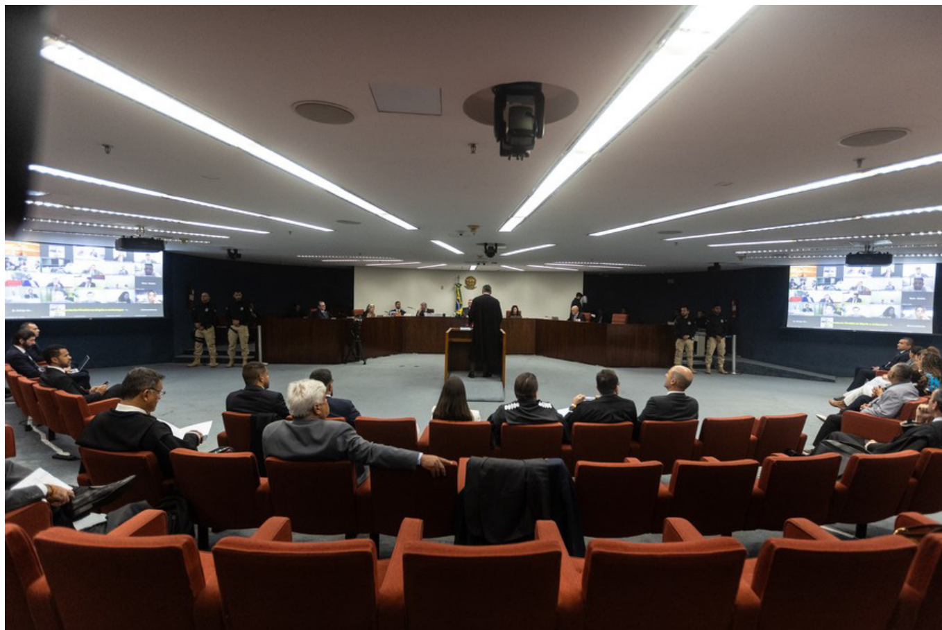
Plenário da 1ª Turma do STF onde aconteceu o julgamento do caso Marielle