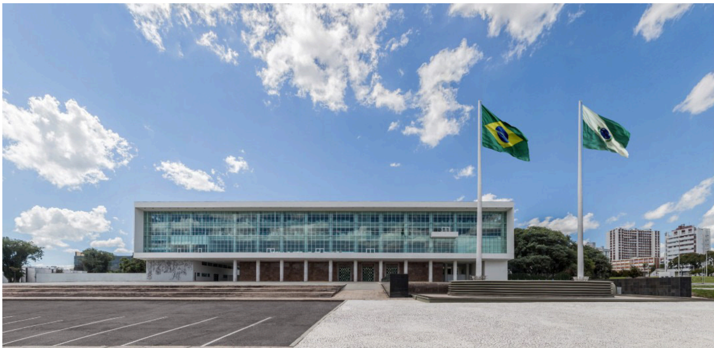
Foto / Reprodução - Imagem mostra fachada do Palácio Iguazu, sede do governo paranaense