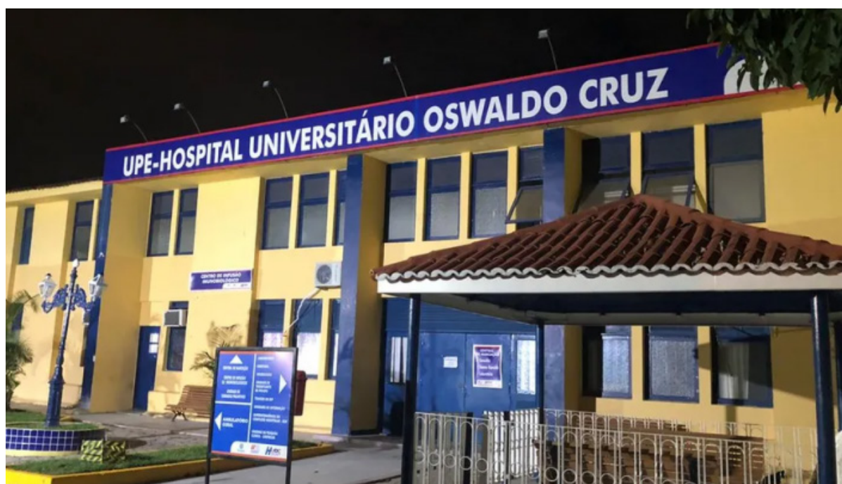
Imagem mostra fachada do Hospital Oswaldo Cruz

Especialistas do Hospital Alemão Oswaldo Cruz mostram como doenças crônicas exigem acompanhamento contínuo e olhar ampliado para o paciente