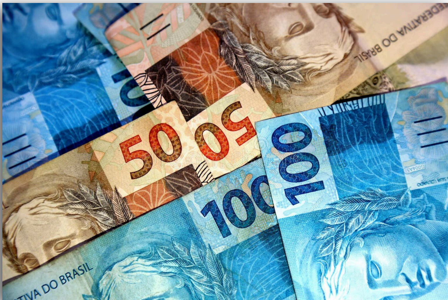
Imagem mostra cédulas de R$ 50,00 e R$ 100,00