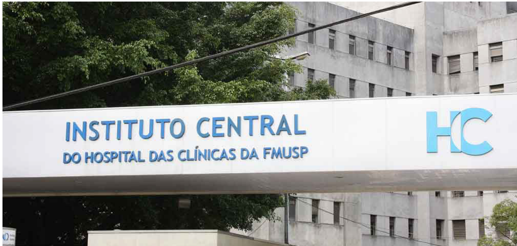
Imagem mostra fachada do Hospital das Clínicas de São Paulo

O Hospital das Clínicas da Faculdade de Medicina da USP (HCFMUSP), vinculado à Secretaria de Estado da Saúde de São Paulo, está entre os melhores hospitais do mundo pelo quarto ano consecutivo, segundo o ranking World's Best Hospitals 2026, elaborado pela revista norte-americana Newsweek em parceria com a Statista.