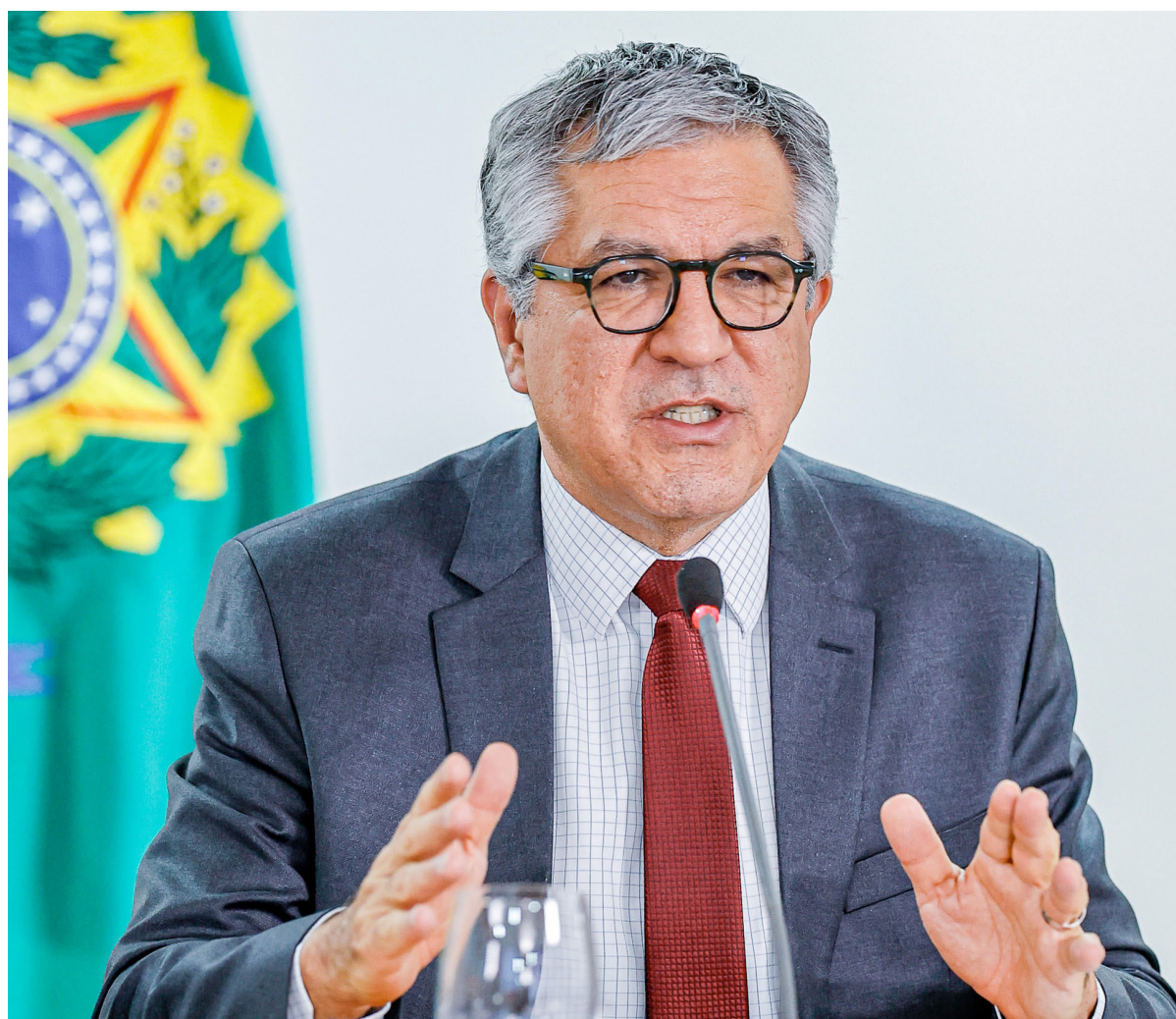
Imagem mostra Ministro da Saúde do Brasil