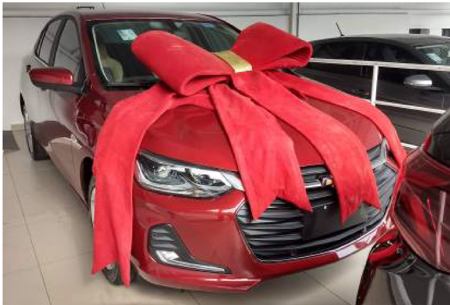
Imagem mostra veículo que pode ser sorteado durante consórcio