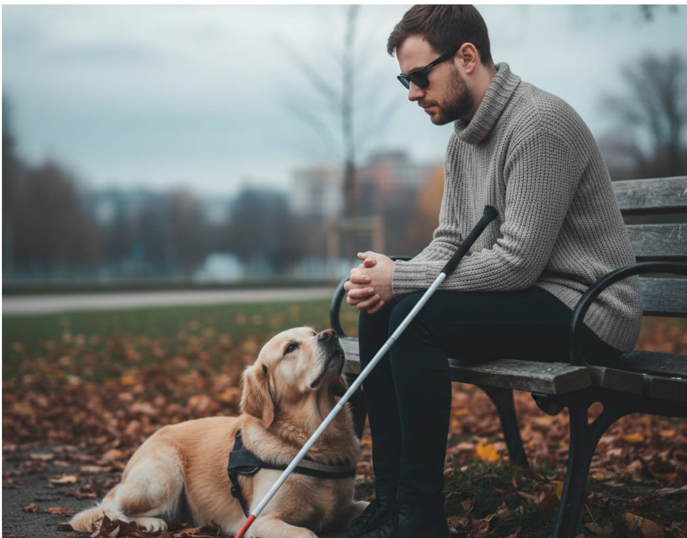
Foto / Reprodução - Imagem mostra representação de uma pessoa com deficiência visual sentada em um banco em uma praça, com uma bengala dobrável e um cão guia, e um semblante pensativo