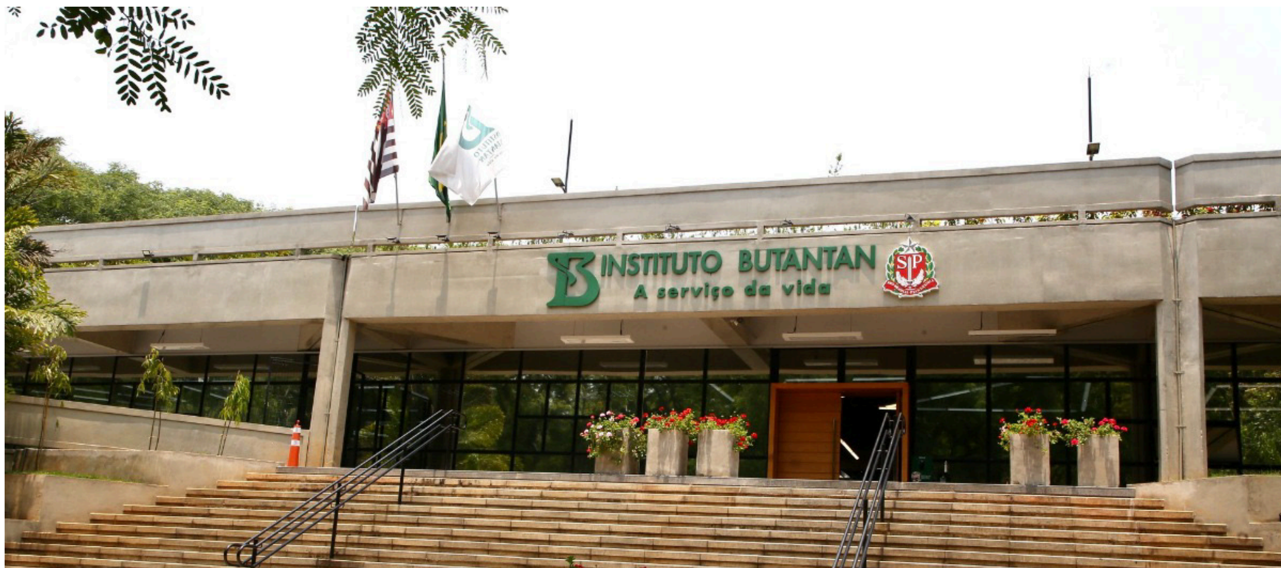
Imagem mostra Instituto Butantan em São Paulo