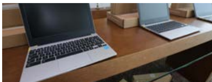
Foto / reprodução - Imagem mostra aparelho Chromebook dados pelo Paraná a escolas da rede municipal de ensino