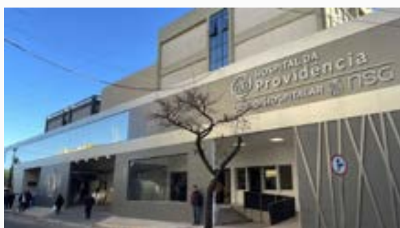
Imagem mostra fachada do Hospital da Providencia em Apucarana