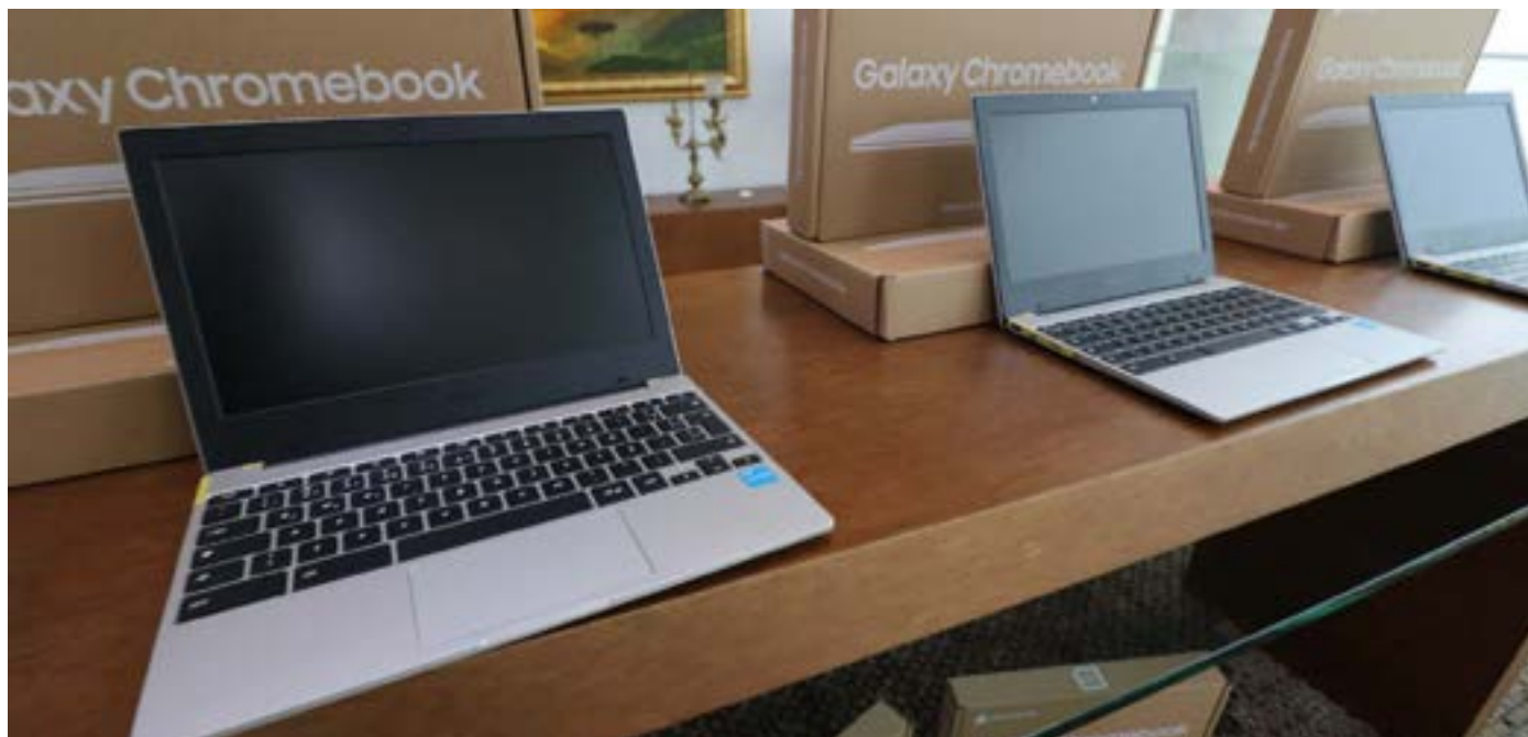
Imagem mostra aparelho Chromebook dados pelo Paraná a escolas da rede municipal de ensino