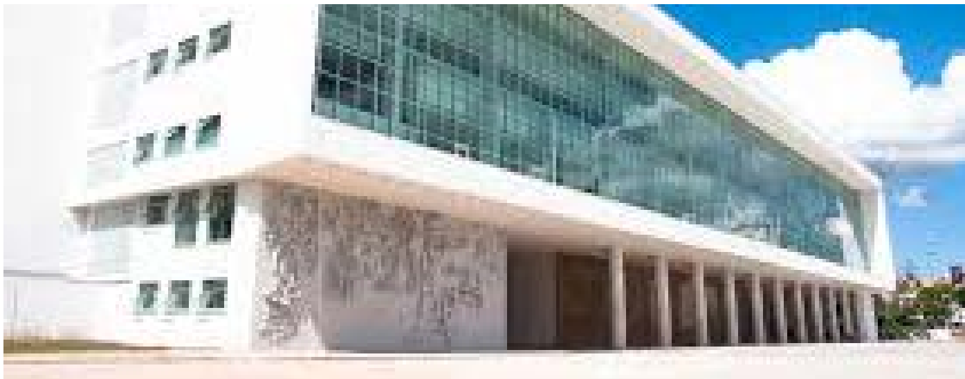
Imagem mostra fachada do Palácio Iguazu, sede do governo paranaense