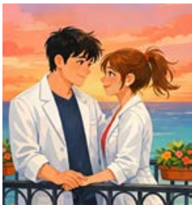
Imagem mostra ilustração de Mikhail e Melissa, protagonistas de livro “Meu Perfeito Amor”