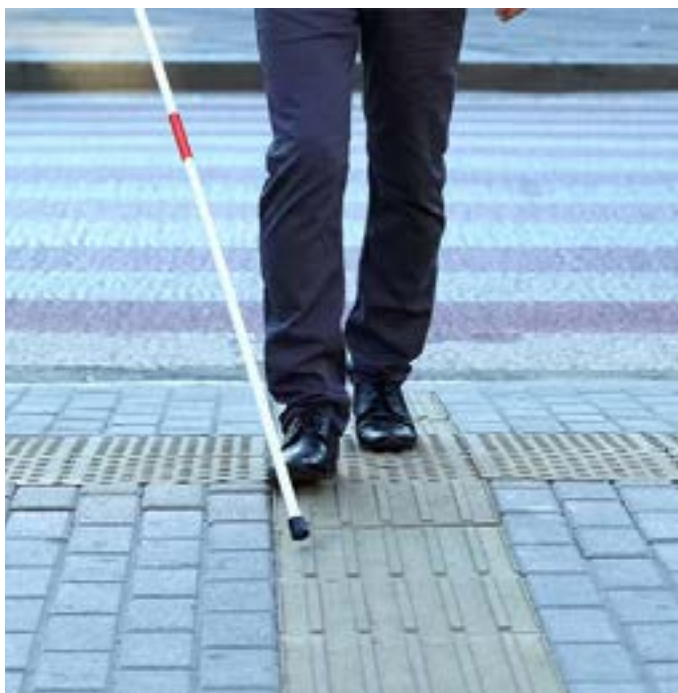
Foto / Reprodução - Imagem mostra representação de uma pessoa com deficiência visual