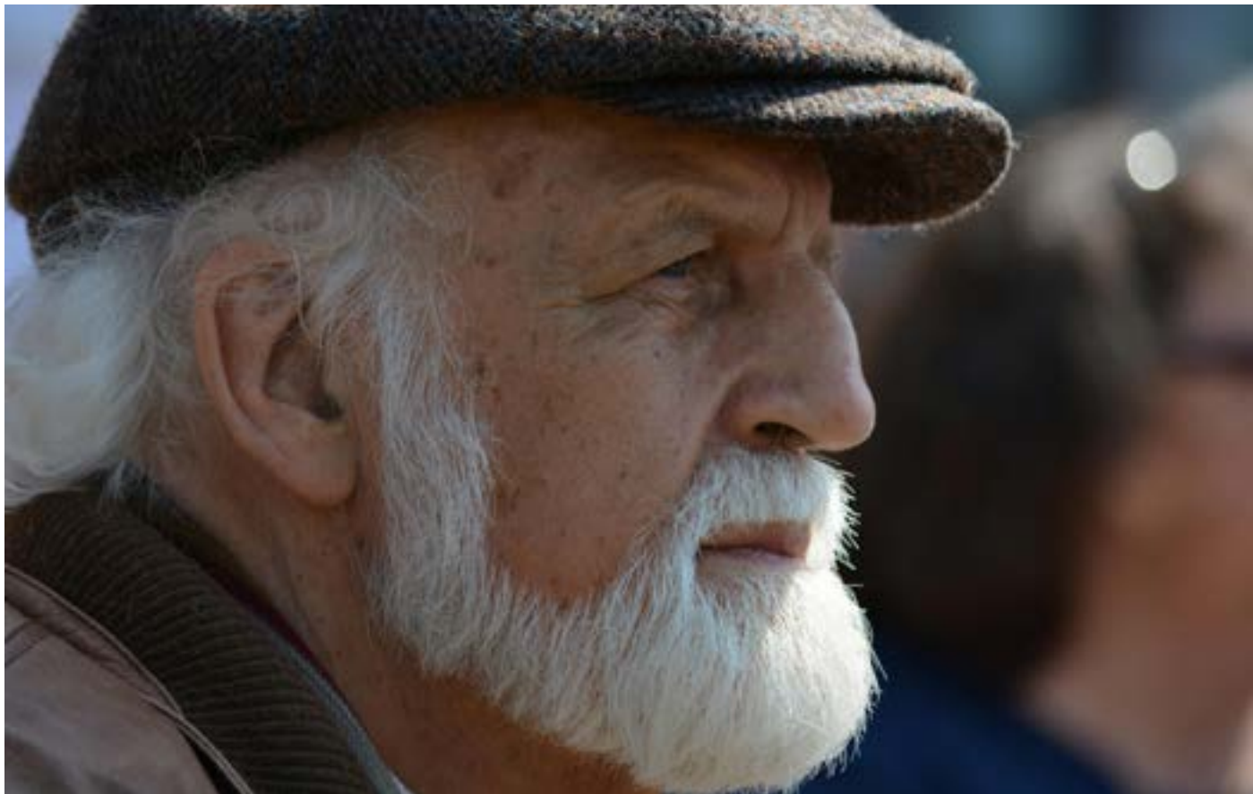
Imagem mostra representação de um idoso