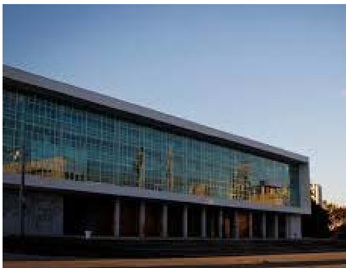
Imagem mostra Palácio do Iguazu, em Curitiba