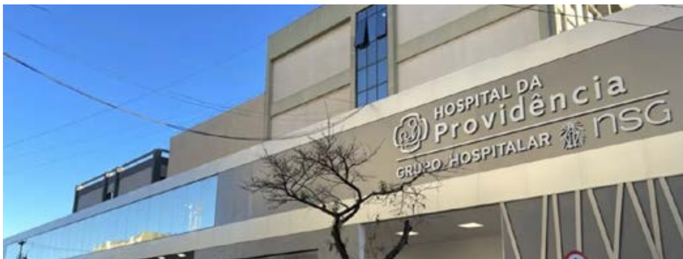
Imagem mostra fachada do Hospital da Providencia em Apucarana