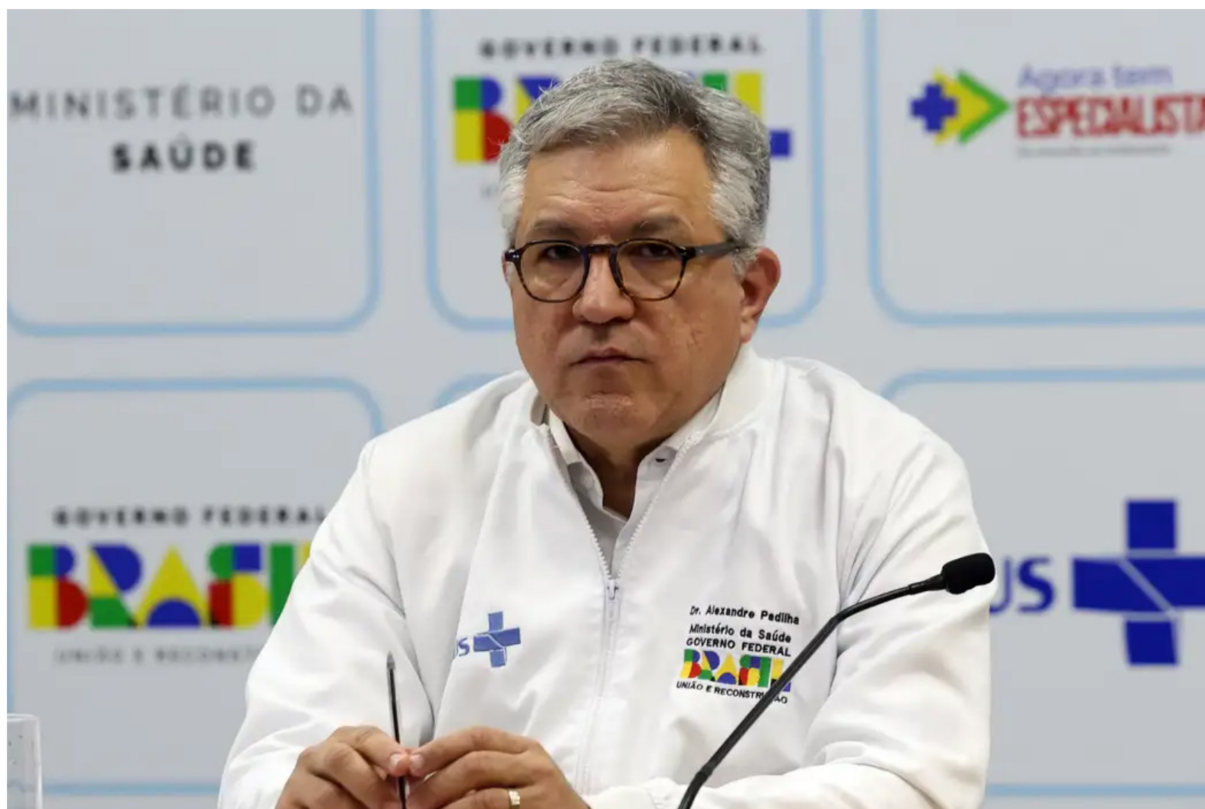
Imagem mostra Ministro da Saúde Alexandre Padilha

O número de adultos brasileiros com diabetes aumentou 135% entre 2006 e 2024, passando de 5,5% para 12,9% da população. No mesmo período, também houve crescimento significativo em outras condições: hipertensão, 31%; obesidade, 118%; e excesso de peso, 47%. Os dados constam no Vigitel 2025, pesquisa que apresenta um retrato da população brasileira sobre fatores de proteção e de risco para o desenvolvimento de doenças crônicas não transmissíveis (DCNT), como hábitos alimentares e prática de atividades físicas.