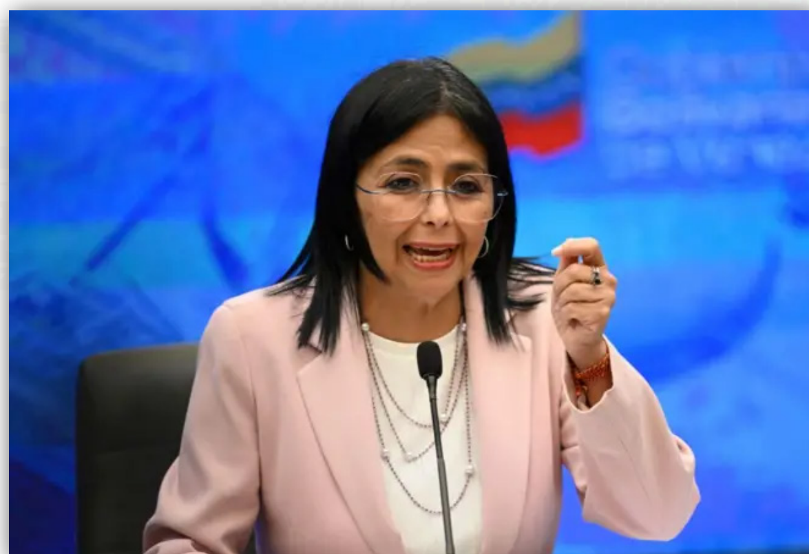
Imagem mostra Presidente Interina da Venezuela Deuci Rodríguez