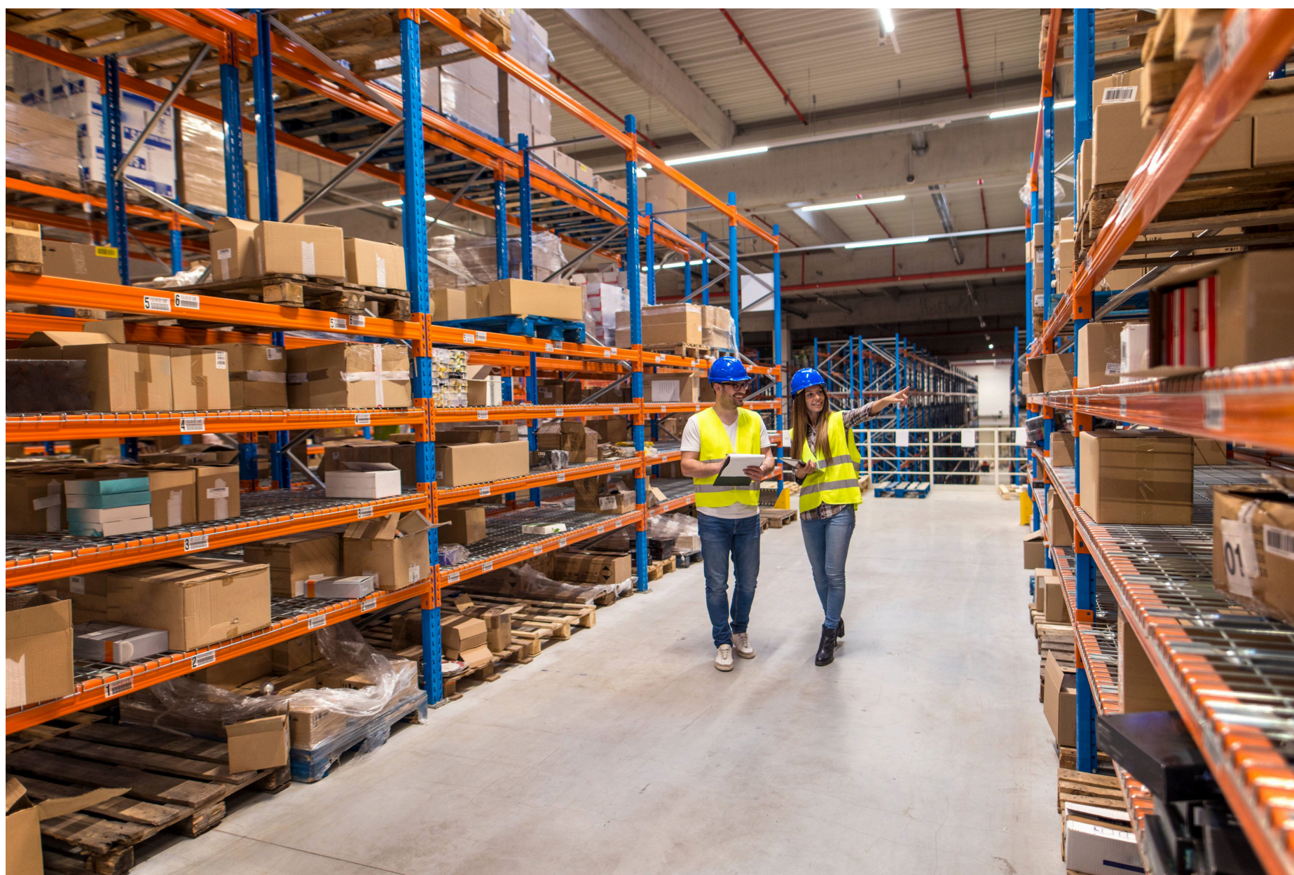
Imagem mostra representação de trabalhadores em uma indústria ou fábrica

O Brasil encerrou 2025 com saldo positivo de 1.279.498 empregos com carteira assinada, resultado de 26,59 milhões de admissões e ante 25,32 milhões de desligamentos registrados entre janeiro e dezembro. Os dados são do Cadastro Geral de Empregados e Desempregados (Novo Caged) e foram divulgados na quinta-feira, 29 de janeiro, pelo Ministério do Trabalho e Emprego.