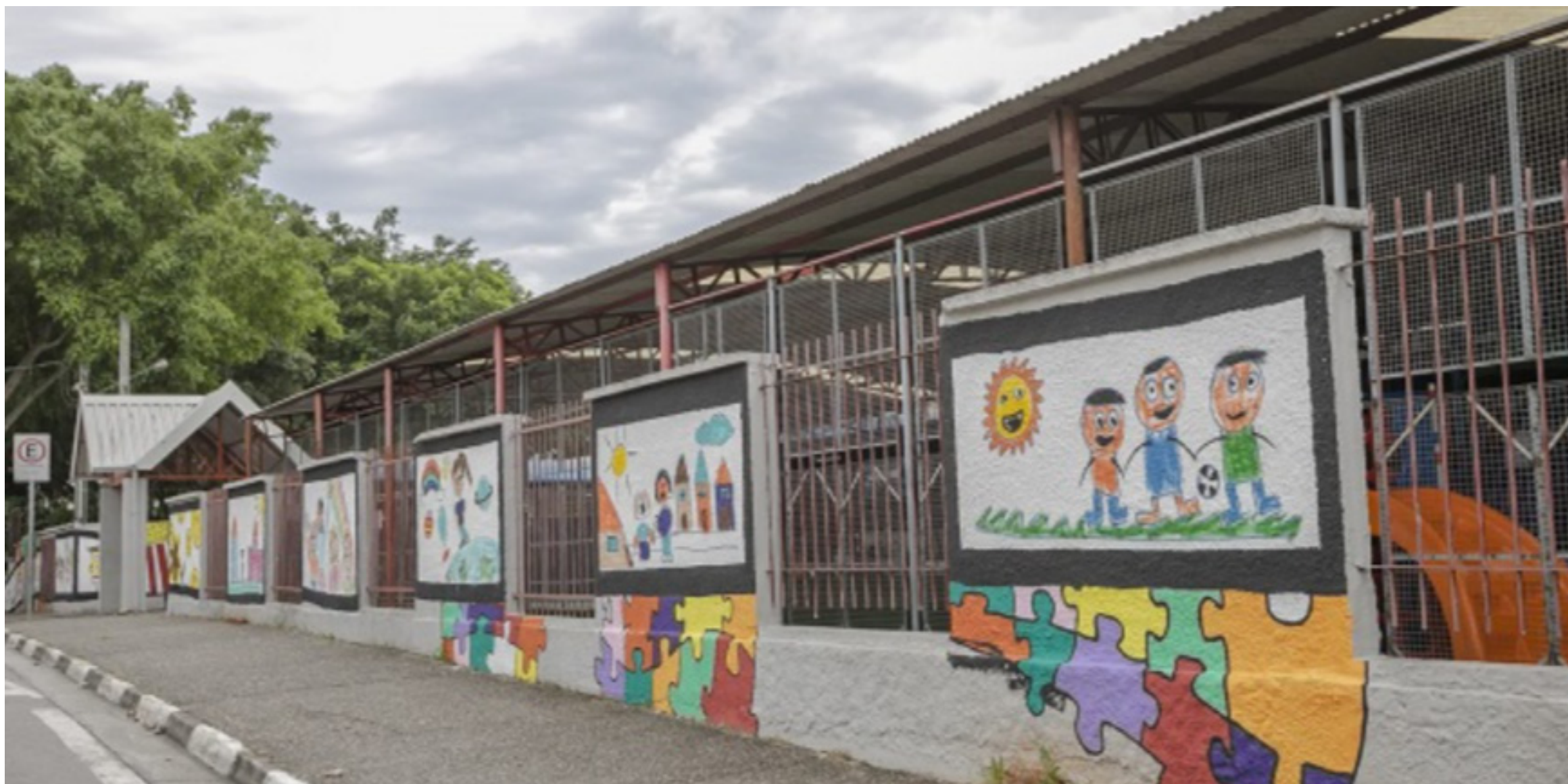
Imagem mostra fachada de escola infantil na capital paulista

Com alcance inédito em 100% das cidades paulistas, o programa Alfabetiza Juntos SP registrou em 2025 o recorde de mais de 330 mil crianças de até 7 anos que sabem ler e escrever na idade certa, ou três a cada quatro avaliadas. É o que aponta a mais recente Avaliação de Fluência Leitora, coordenada pelo Governo de São Paulo e que completou 3 anos com método unificado, em parceria com as prefeituras.