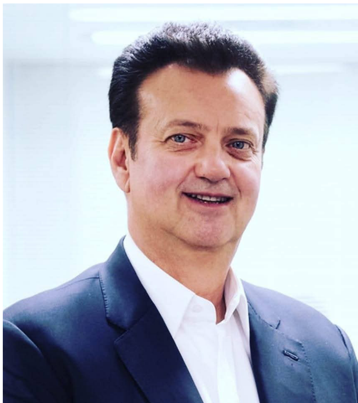
Imagem mostra Presidente do PSD Gilberto Kassab