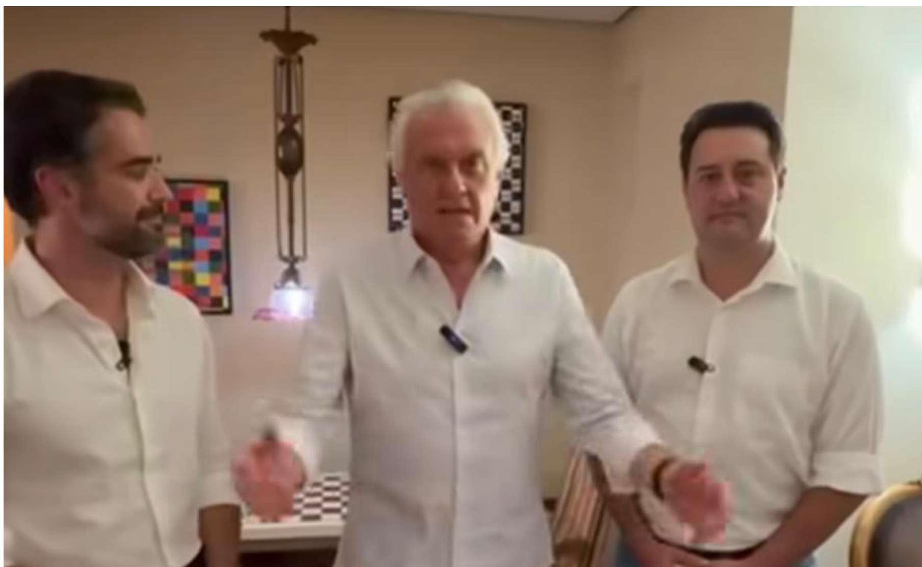
Imagem mostra governadores Ronaldo Caiado, Eduardo Leite e Ratinho Junior.