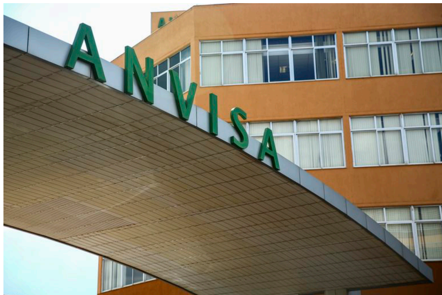
Imagem mostra fachada da Anvisa

A Agência Nacional de Vigilância Sanitária (Anvisa), proibiu a fabricação, venda e distribuição de canetas emagrecedoras das marcas Synedica e TG.