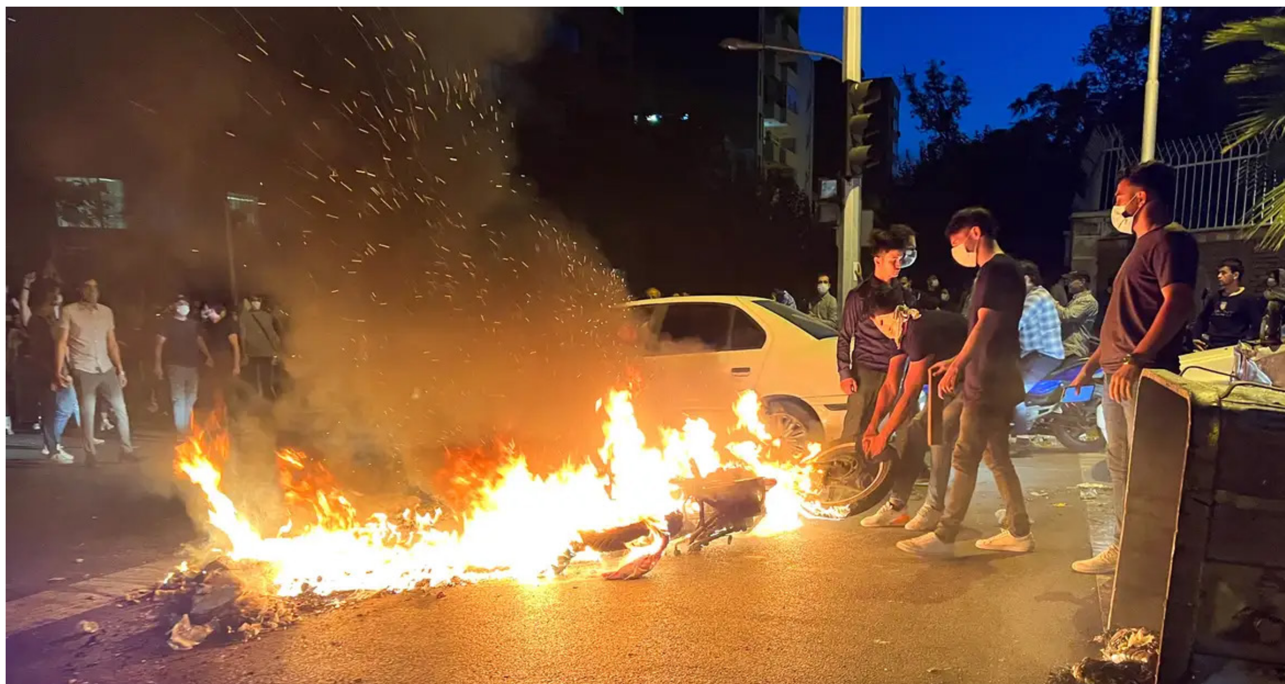
Imagens mostram cenas de protesto no Irã

Os violentos protestos no Irã reprimidos com força pelo regime do governo atual, deixaram ao menos 43 mil mortos segundo organizações internacionais de direitos humanos.