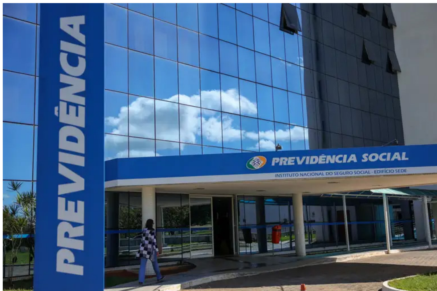
Imagem mostra fachada de agência do INSS