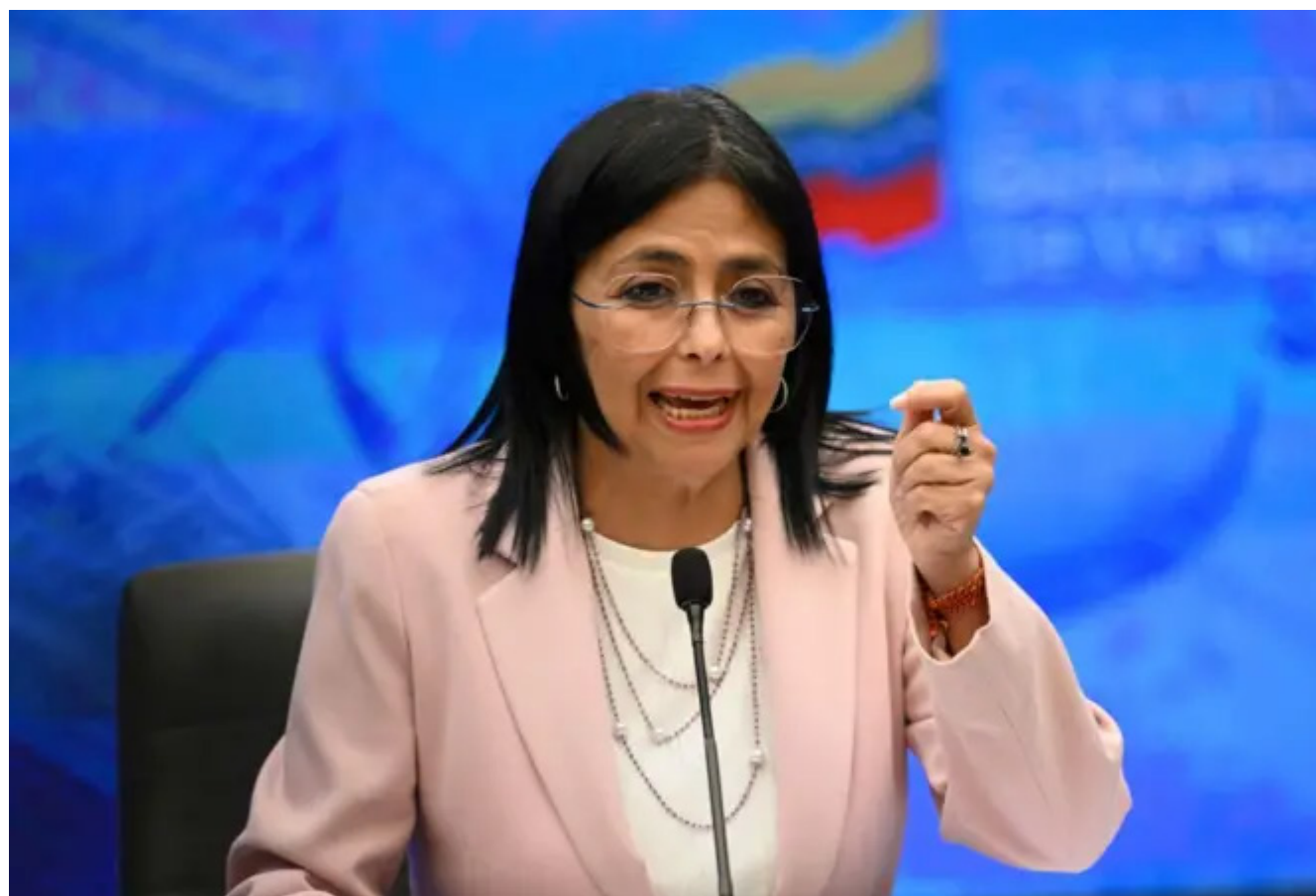
Imagem mostra Presidente Interina da Venezuela Deuci Rodríguez

A Venezuela anunciou por meio de sua Presidente Interina na última sexta-feira, 30 de janeiro, uma lei geral de anistia.