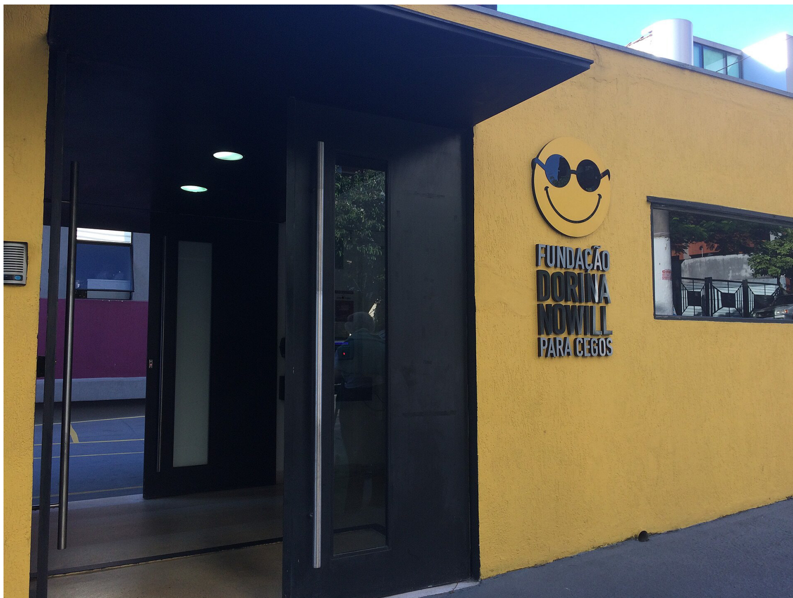
Imagem mostra fachada da Fundação Dorina Nowill

A Prefeitura de São Paulo, renovou na última semana, a concessão dos direitos de área para uso do Instituto Fundação Dorina Nowill, voltado a atender deficientes visuais.