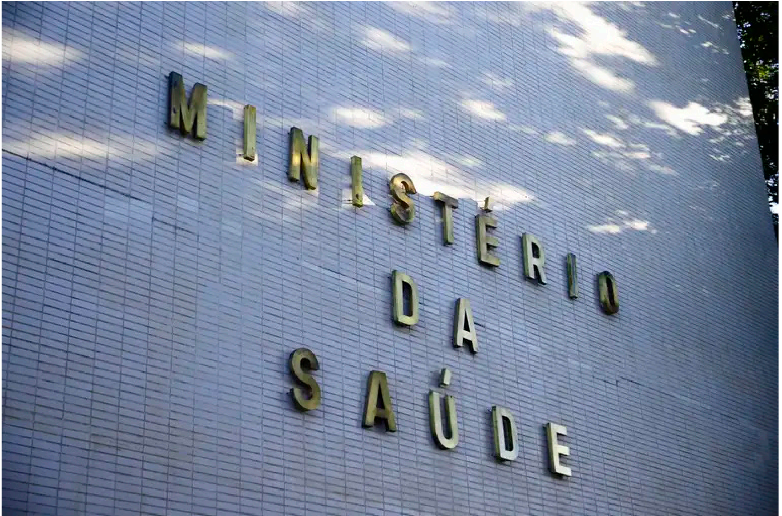
Imagem mostra fachada do Ministério da Saúde