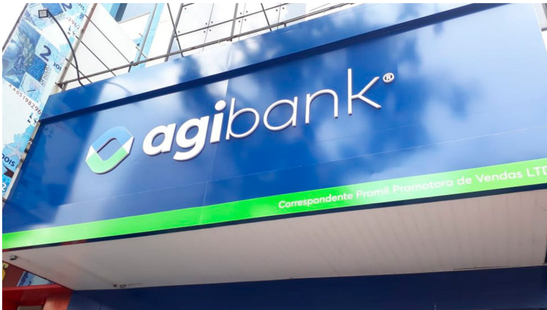
Foto / Reprodução - Imagem mostra fachada de uma loja correspondente Agibank

Por Guilherme Kalel: Jornalista e Editor