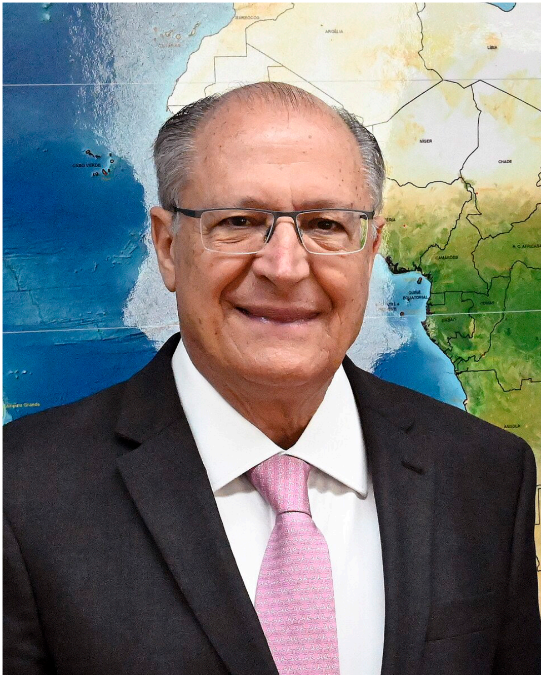
Imagem mostra Vice-Presidente Geraldo Alckmin