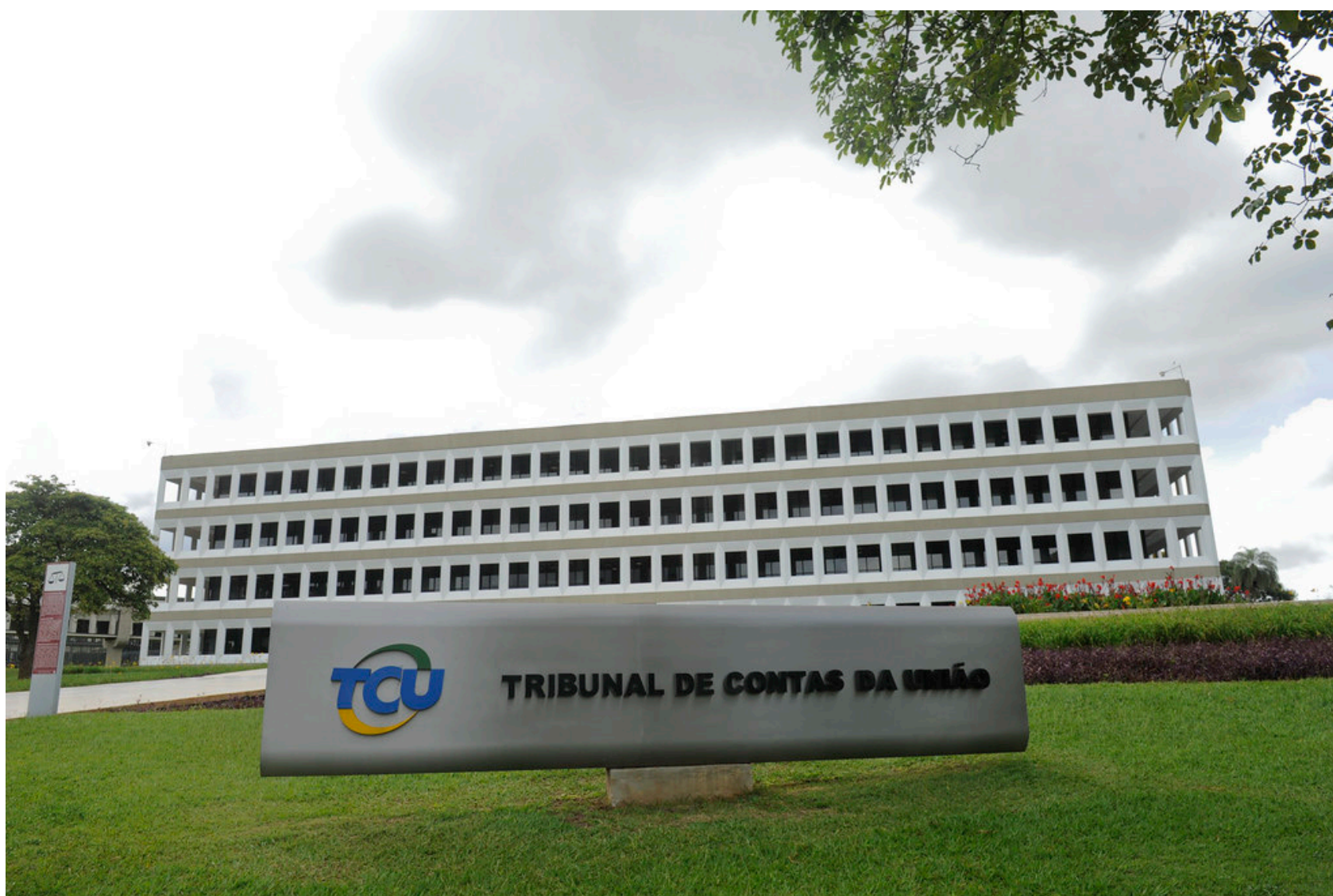
Imagem mostra fachada do Tribunal de Contas da União (TCU)

O Tribunal de Contas da União, determinou que o governo federal, retome investimentos que foram paralisados, em agências reguladoras do país.