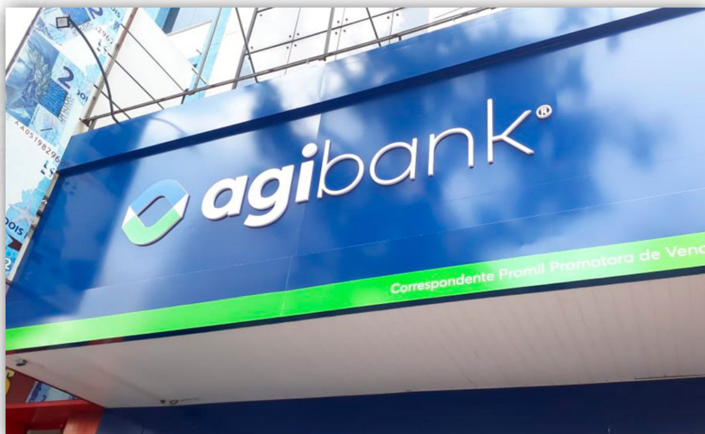
Imagem mostra fachada de uma loja correspondente Agibank