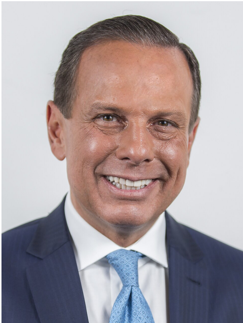
Imagem mostra ex-governador de São Paulo João Doria