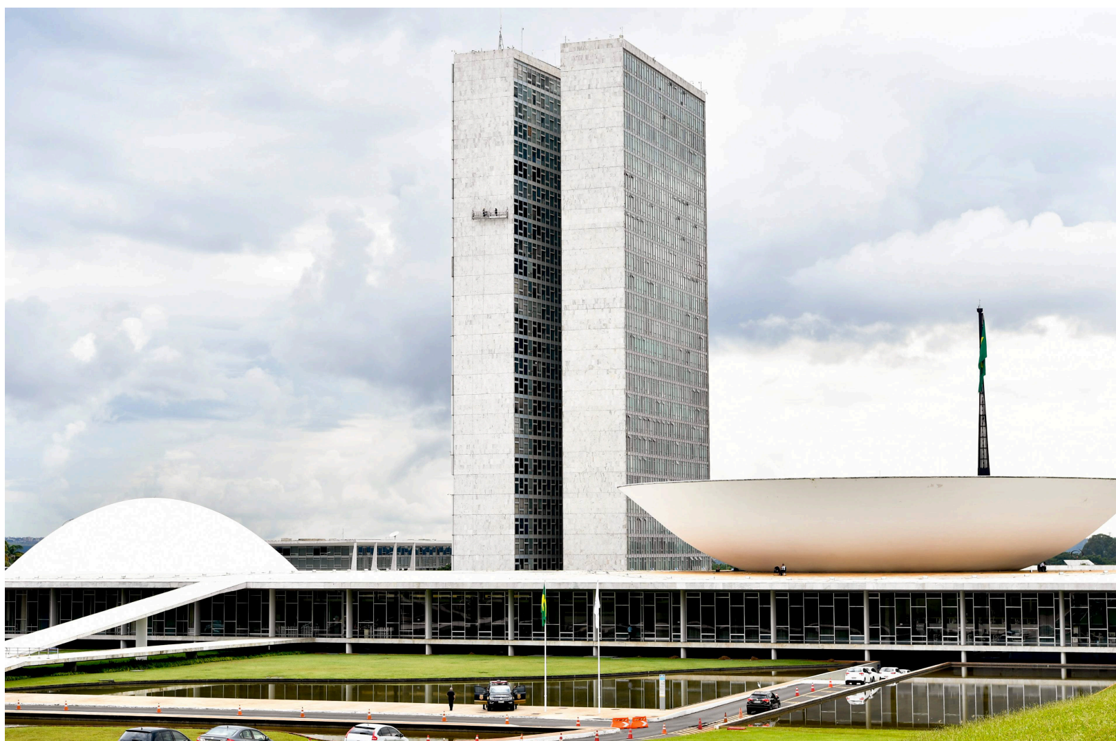
Imagem mostra fachada do Congresso Nacional

O governo federal brasileiro, publicou na última quarta-feira, 11 de fevereiro, as regras para uso do cadastro biométrico obrigatório para beneficiários sociais.