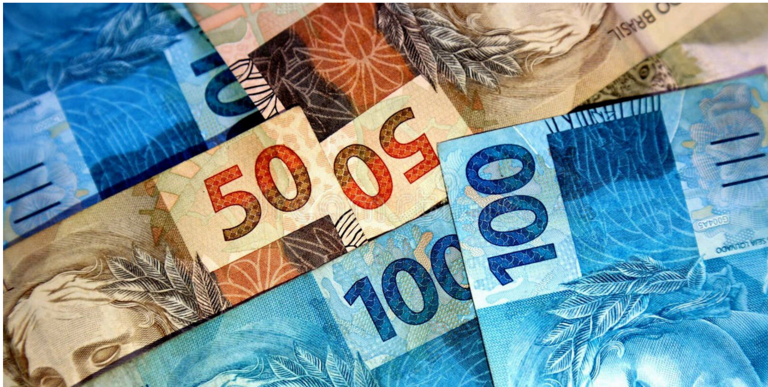
Imagem mostra cédulas de R$ 50,00 e R$ 100,00