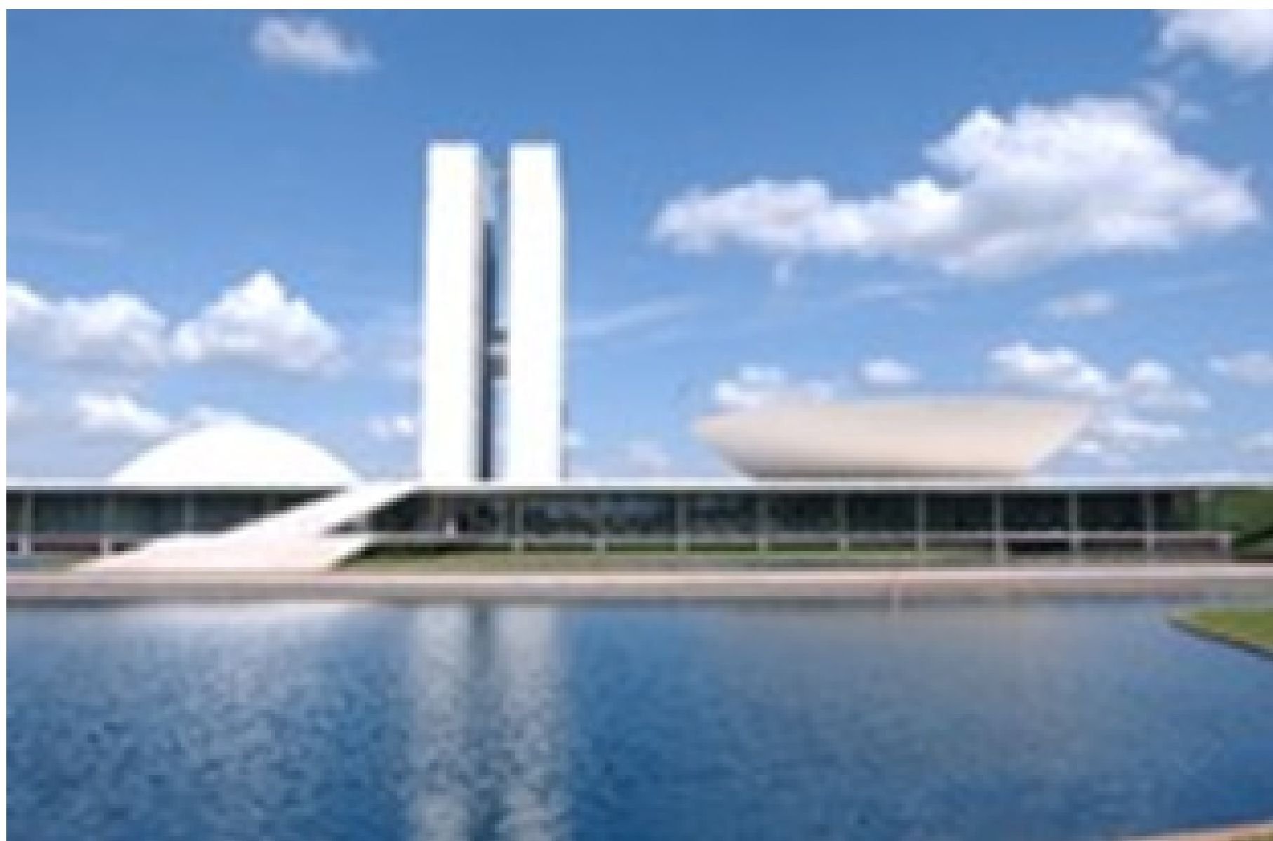
imagem mostra fachada do congresso