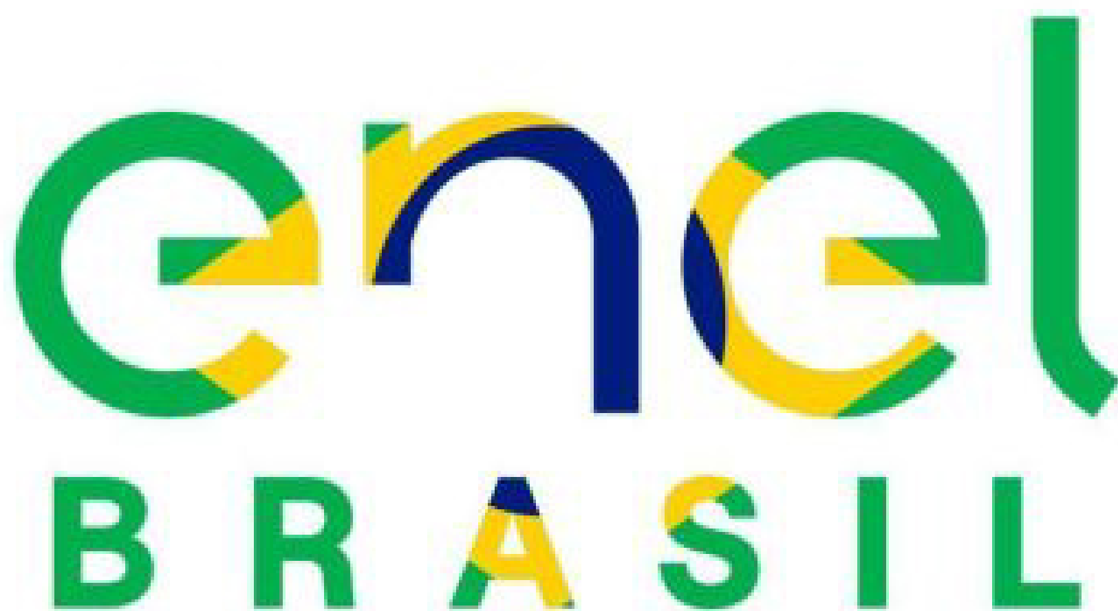
Imagem mostra logo da Enel