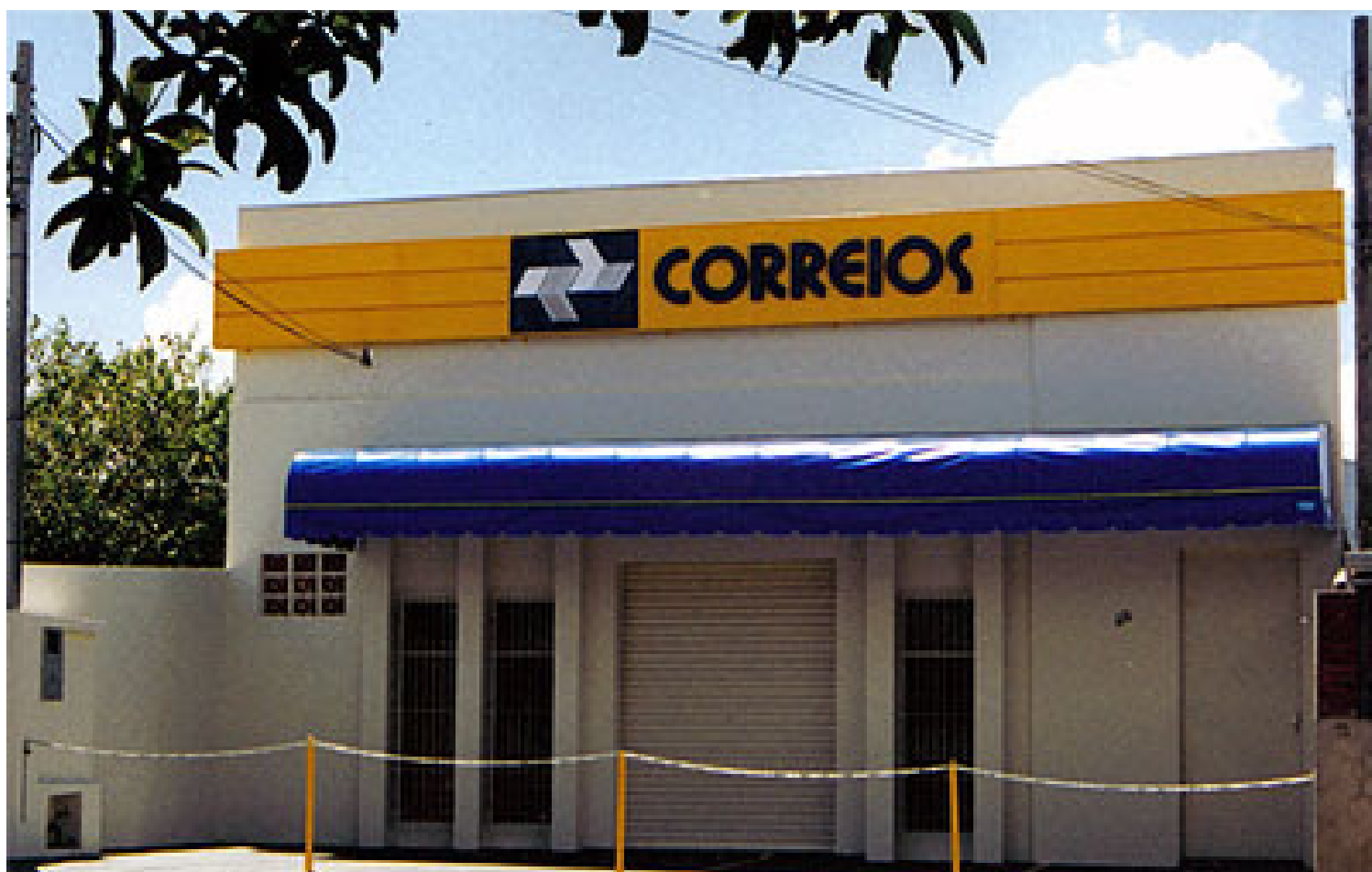
Imagem mostra agência dos Correios