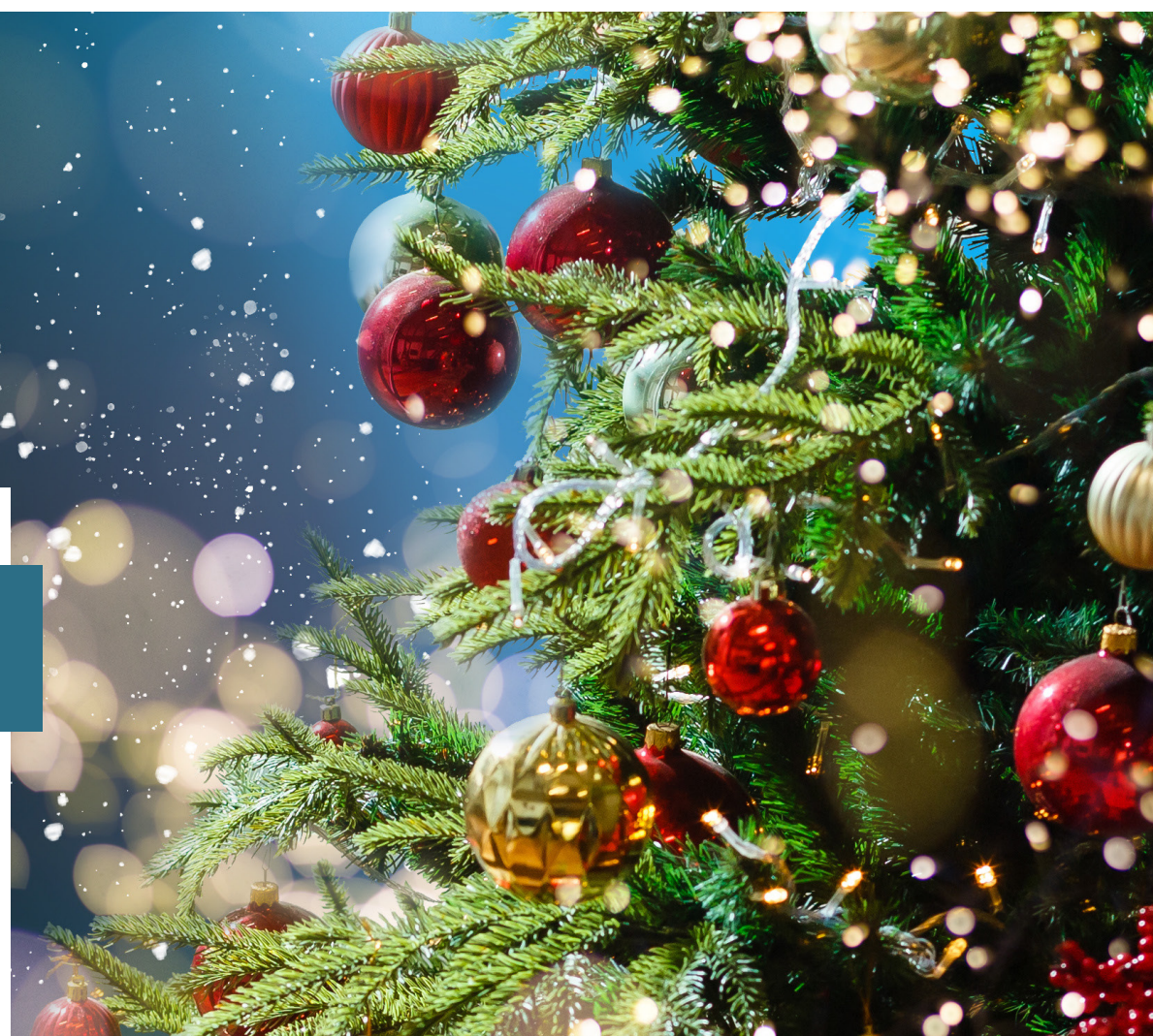
Imagem representativa ao Natal mostra uma árvore Natalina