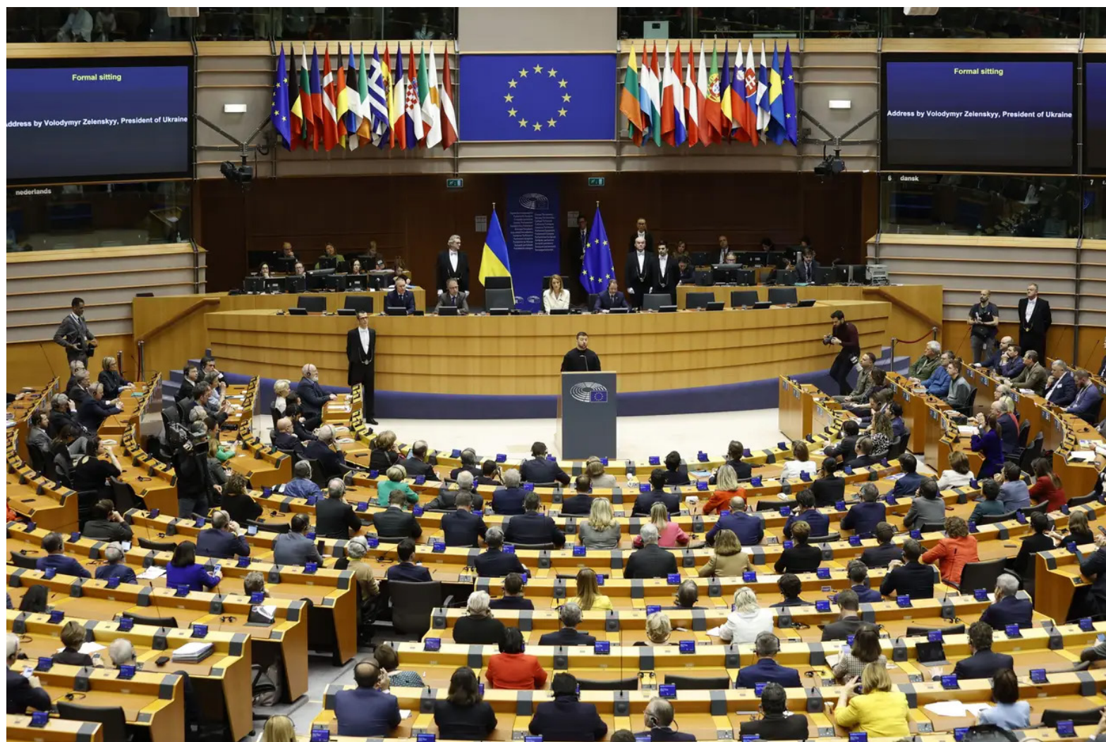
Foto / Reprodução - Presidente do Parlamento Europeu fala a imprensa em anúncio de apoio a Ucrânia

A união Europeia anunciou na sexta-feira, 19 de dezembro, um apoio adicional para a Ucrânia na guerra contra a Rússia.