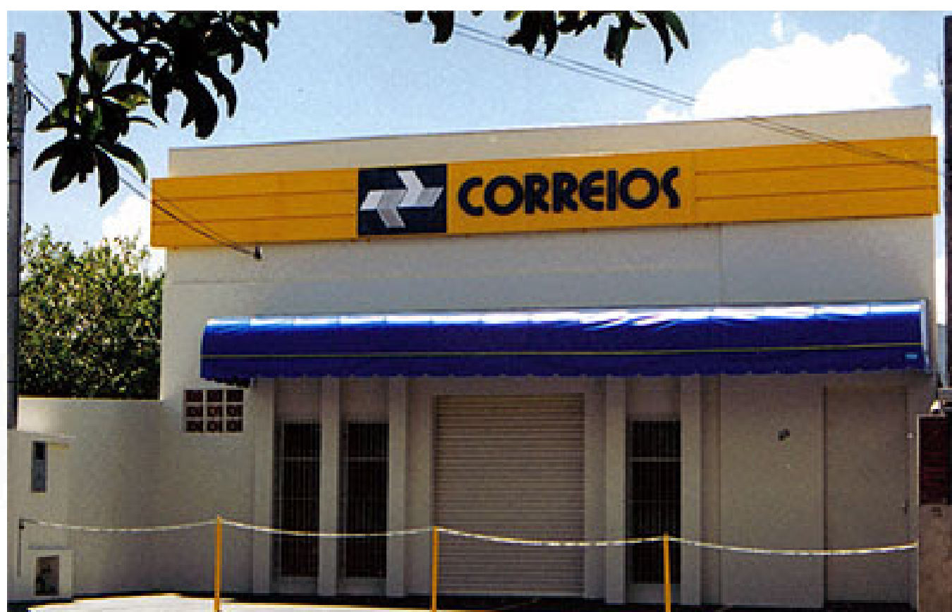
Imagem mostra agência dos Correios