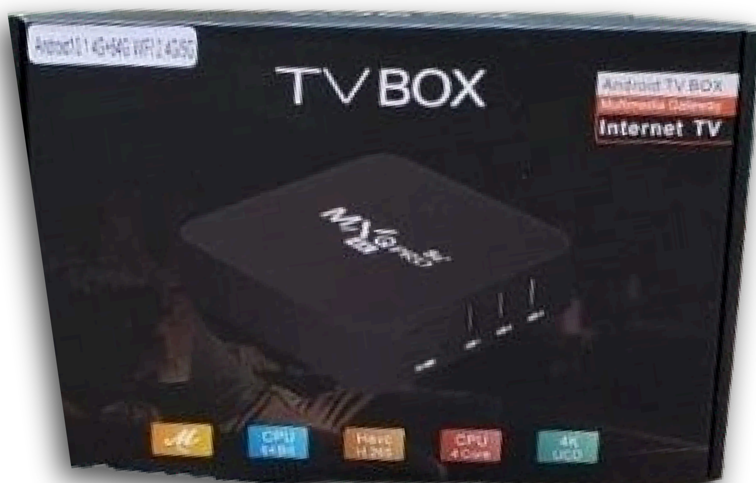
Imagem mostra um aparelho de TV box pirata

Foram mais de 500 diferentes endereços de sites encerrados, alguns com bastante conhecimento do público, e que ofertavam os serviços de R$ 15,00 a R$ 30,00 por mês.