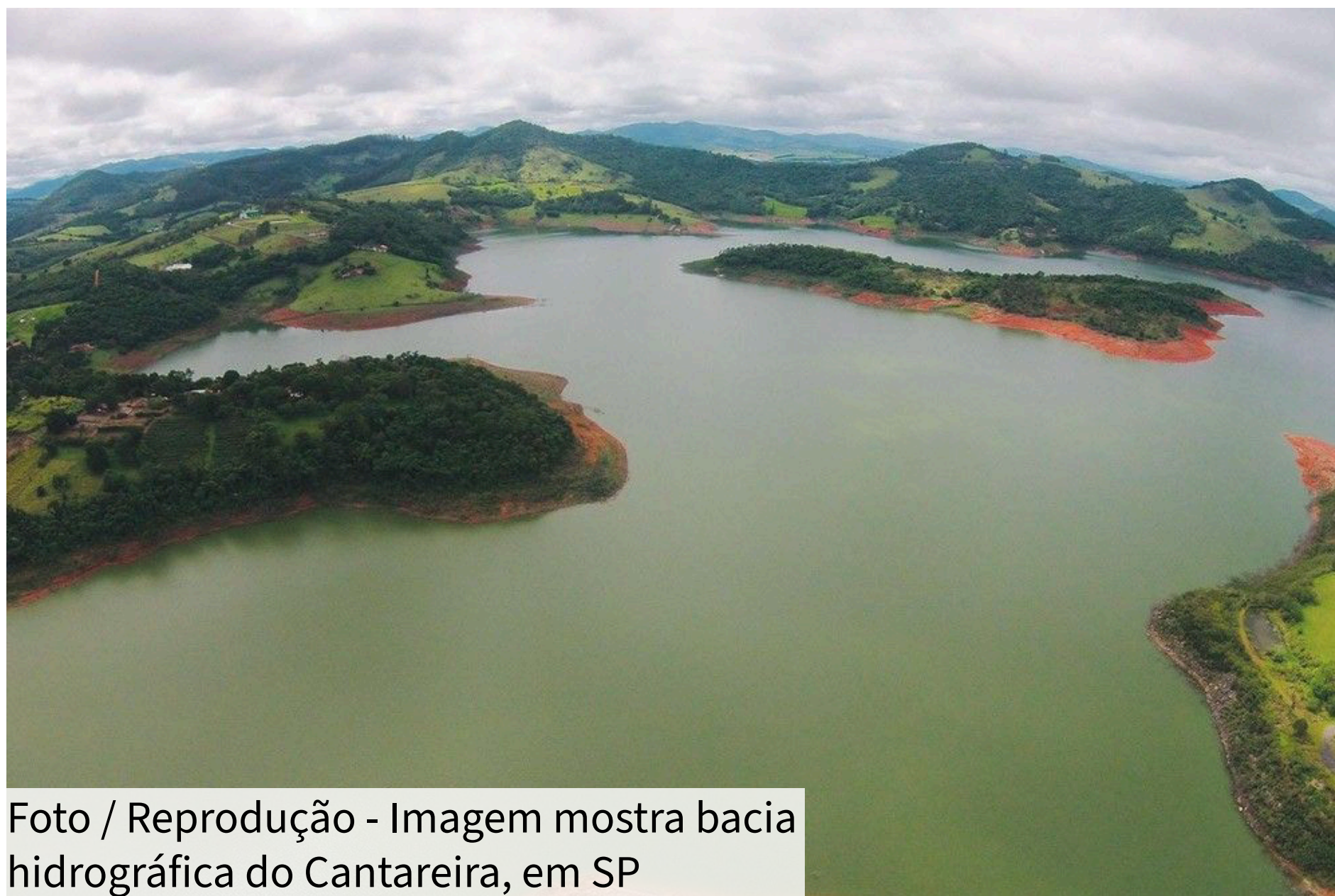
Imagem mostra bacia hidrográfica do Cantareira, em SP