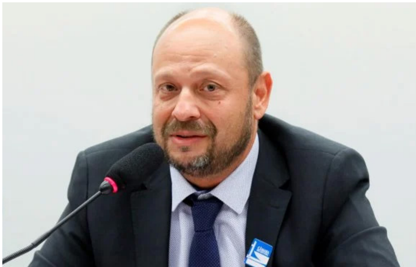
Imagem mostra Presidente do INSS Gilberto Woller