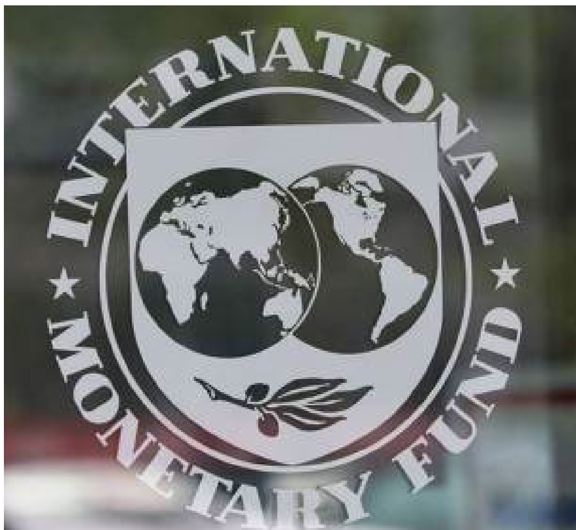
Imagem mostra logo do FMI

O Fundo Monetário Internacional (FMI), apresentou projeções nada otimistas para a economia brasileira em 2026.