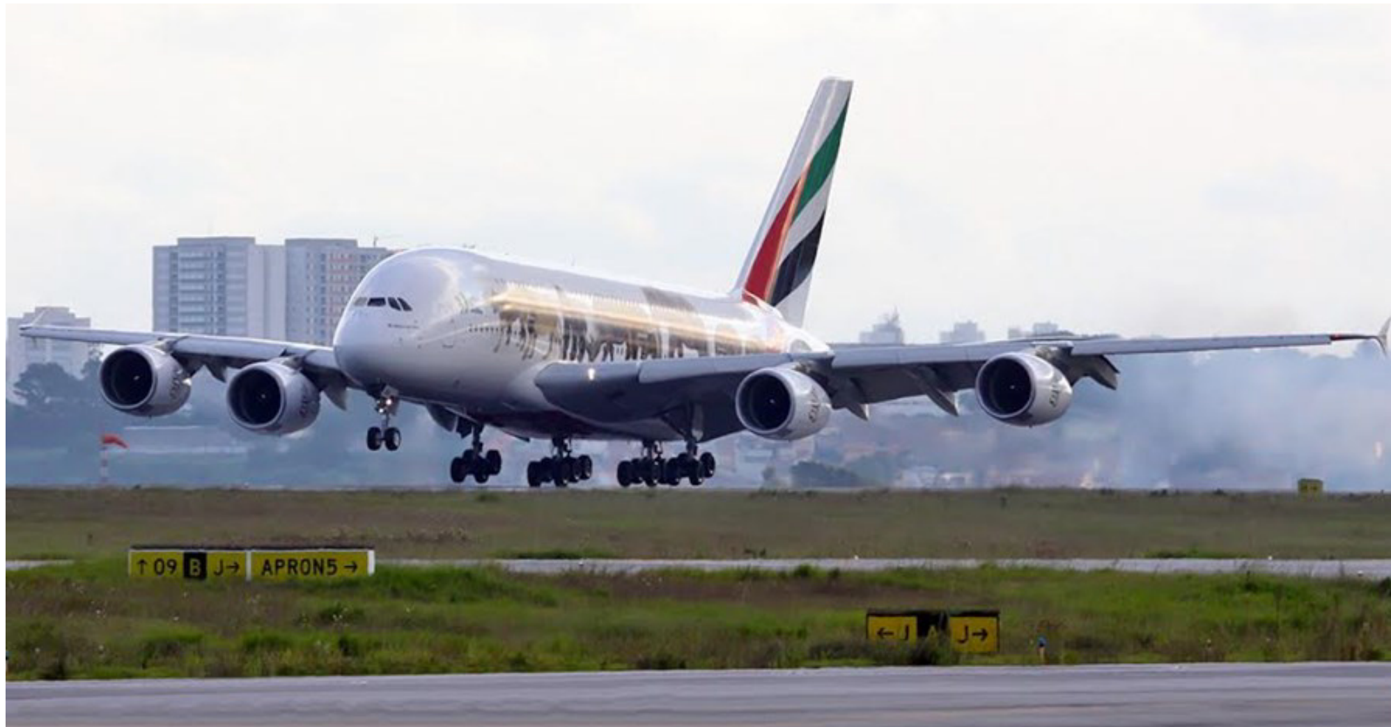
Avião em Aeroporto de Guarulhos em São Paulo

O Governo federal brasileiro, anunciou em 2023, no primeiro ano do atual mandato do Presidente Luiz Inácio Lula da Silva, que lançaria um programa com passagens de avião a R$ 200,00.