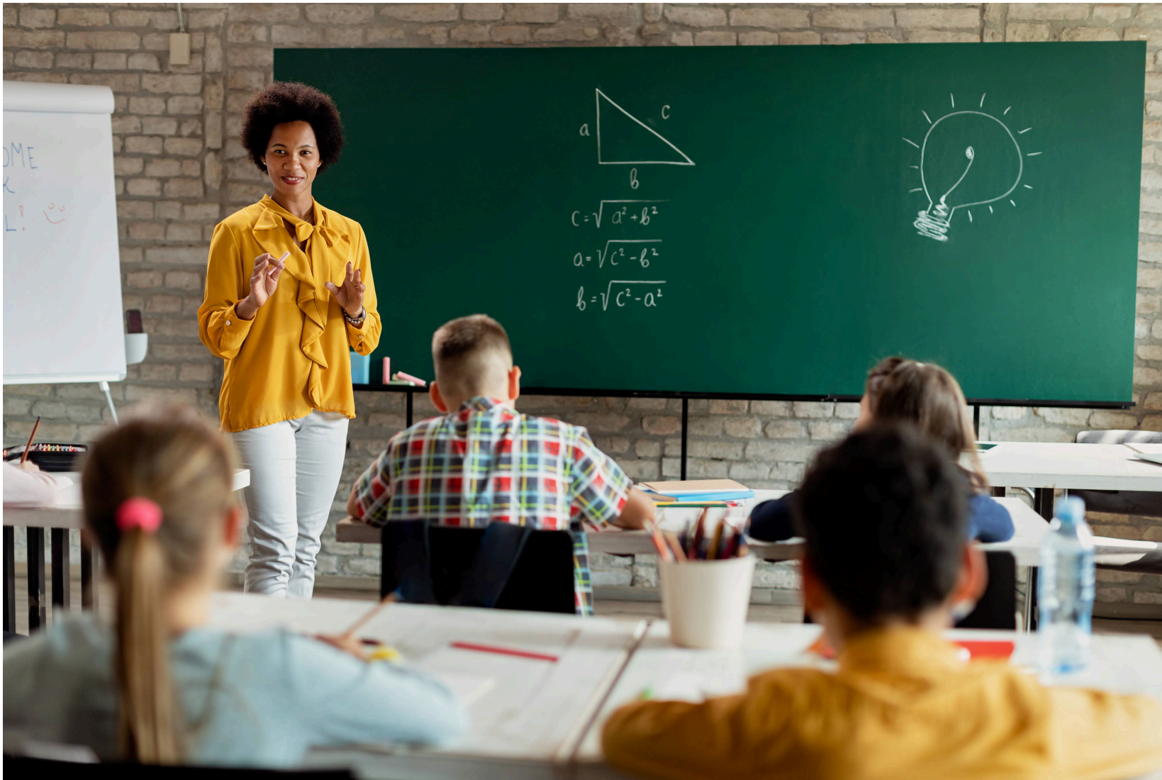
Imagem mostra representação de um professor em sala de aula

O governo federal anunciou em 2025, uma grande vitória para o povo brasileiro. Quem ganha até R$ 5000,00 estaria isento de pagar o Imposto de Renda, dando folga no Orçamento de milhões de famílias pelo país. O resultado depois disso, foi uma série de pessoas que comemoraram o avanço dessa que o governo chamou de política social.