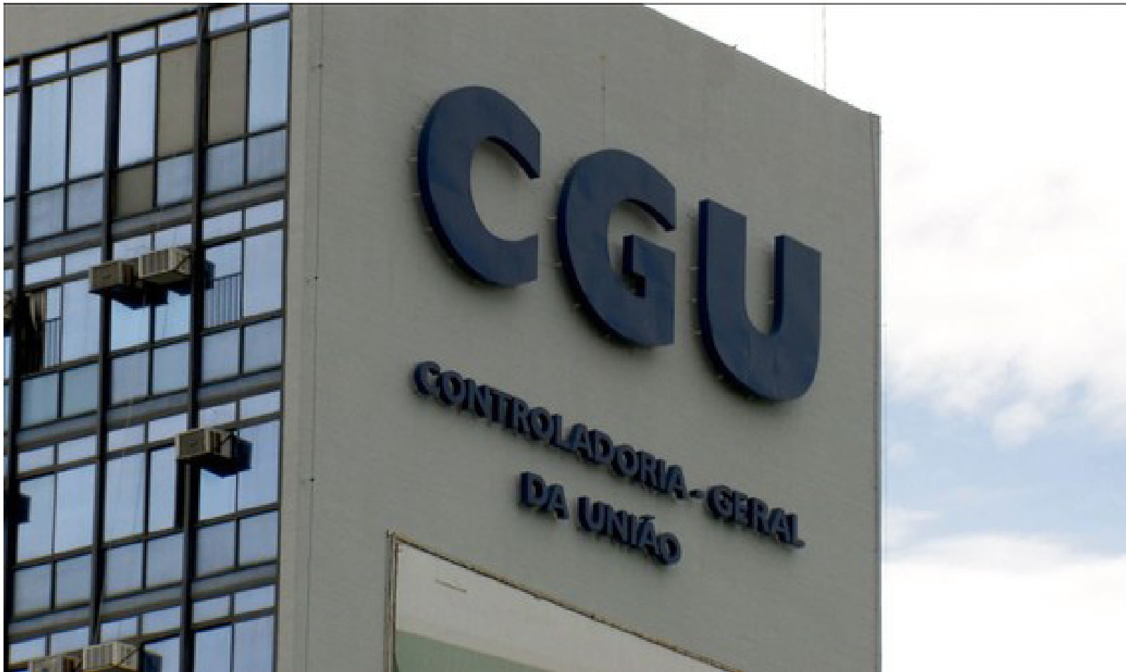
Imagem mostra fachada da Controladoria-Ger al da União

A Controladoria-Geral da União (CGU) publicou, na terça-feira, 21, no Diário Oficial da União, sanções administrativas aplicadas a nove empresas envolvidas em fraudes em licitações públicas e execução de contratos com recursos federais. As penalidades, que somam mais de R$ 211 milhões em multas, resultam de investigações que abrangem as operações Lava Jato, Fiat Lux e Topique, além de contratos firmados com a Transpetro e a Superintendência Regional do INSS no Nordeste (SR-IV).