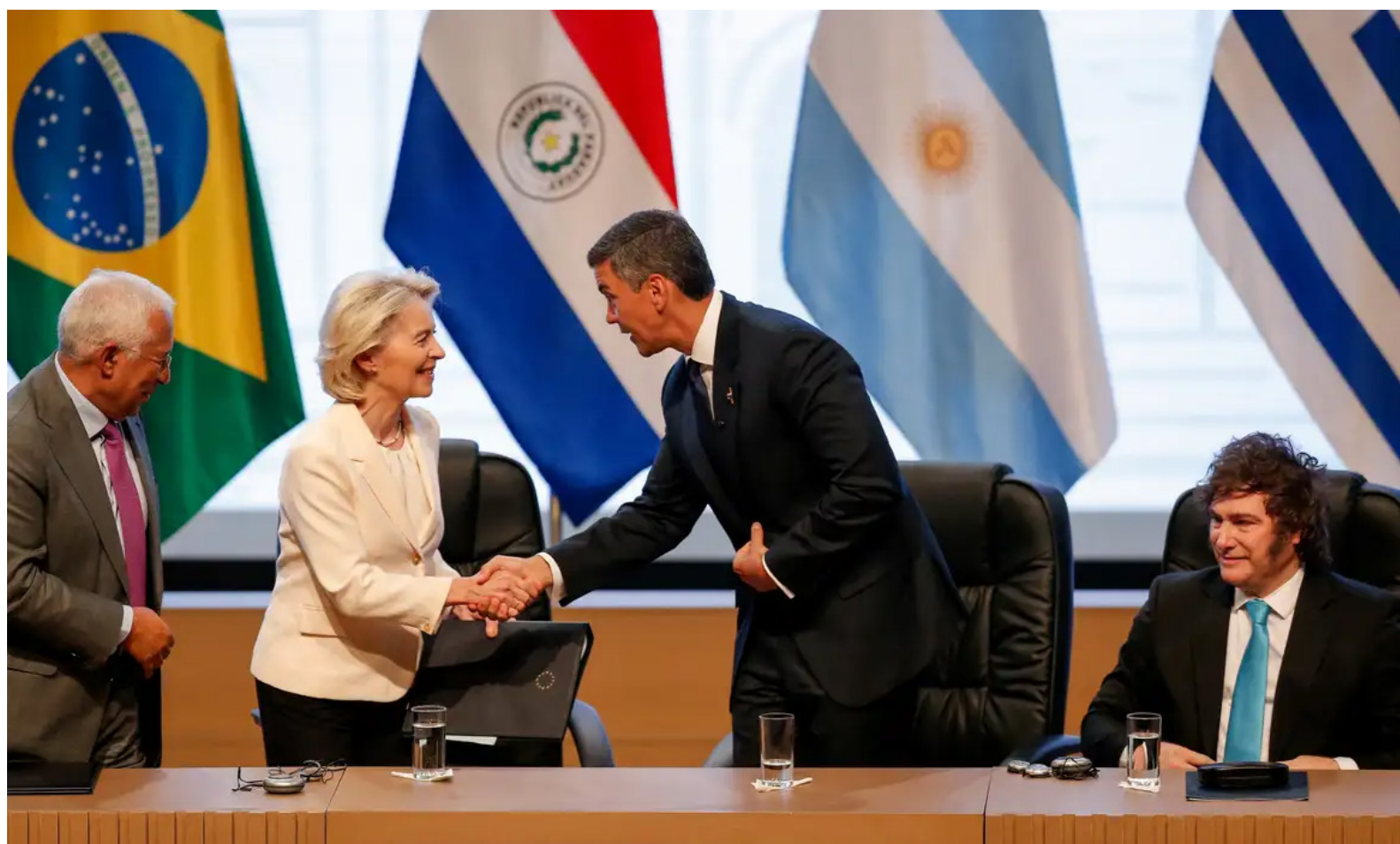
Integrantes do Mercosul e da União Europeia em reunião para assinatura de tratado em 17 de janeiro

Depois de 25 anos de negociações o acordo entre Mercosul e União Europeia finalmente saiu do campo das ideias.