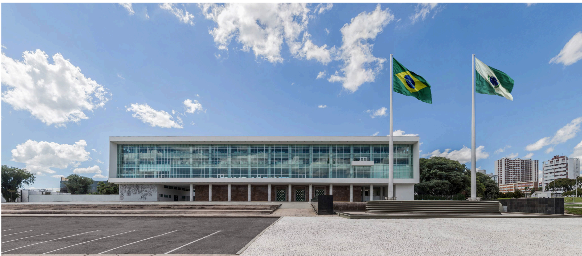
Imagem mostra fachada do Palácio Iguaçu, sede do governo paranaense