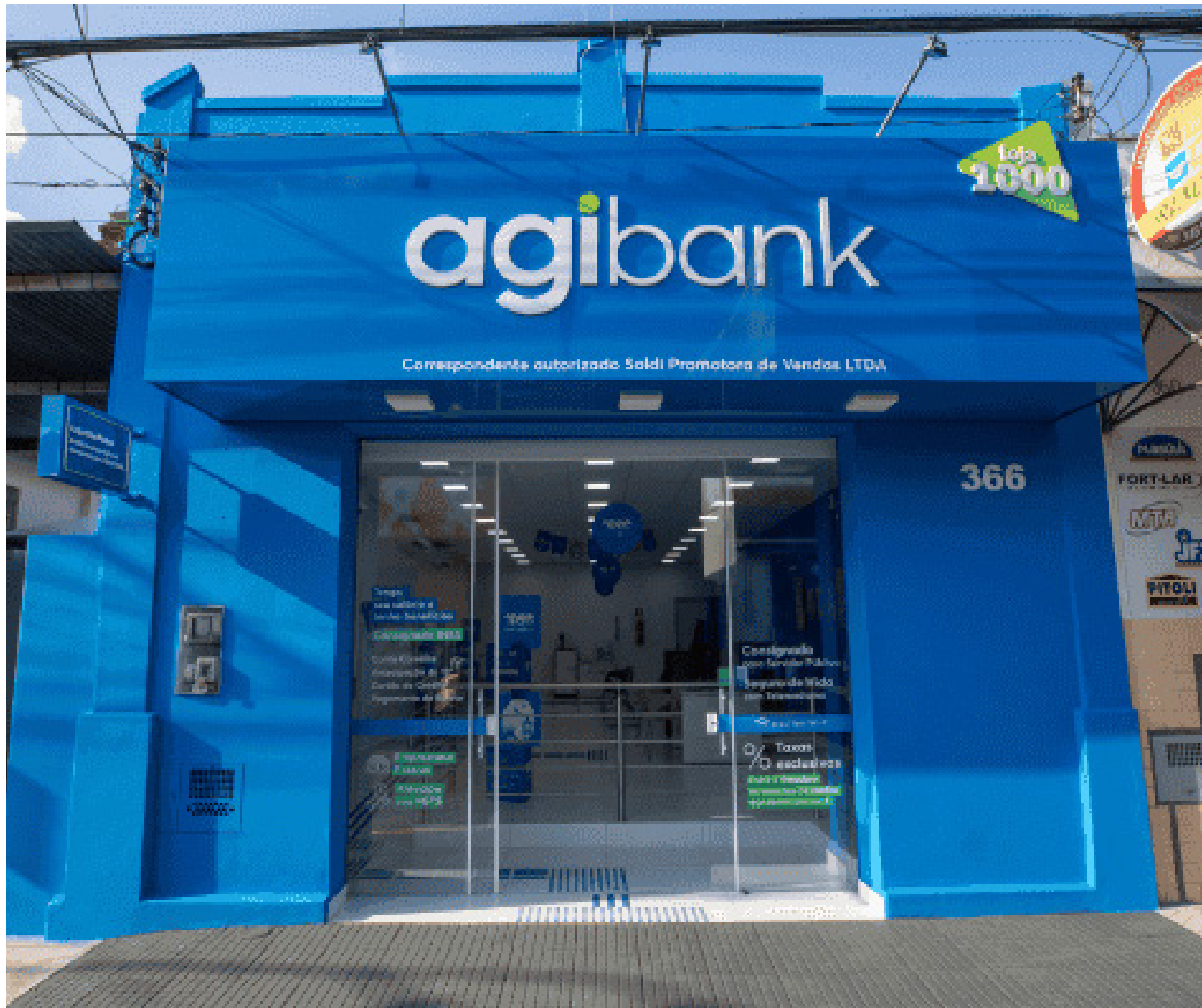
imagem mostra fachada de uma loja correspondente Agibank

O Agibank, que foi suspenso no último 3 de dezembro para realizar créditos consignados junto a aposentados e pensionistas do INSS já pode voltar a fazer as operações.