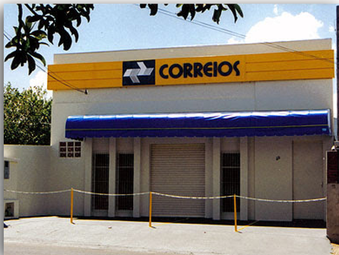
Imagem mostra agência dos Correios