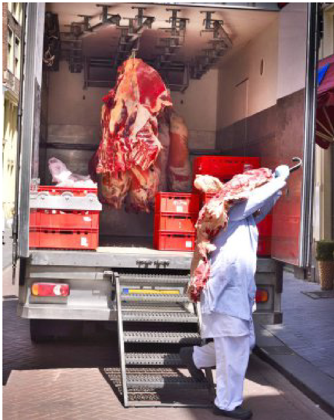
Imagem mostra caminhão frigorífico que transporta carnes

A china anunciou na quarta-feira, 31 de dezembro, impor restrições para carne bovina brasileira.