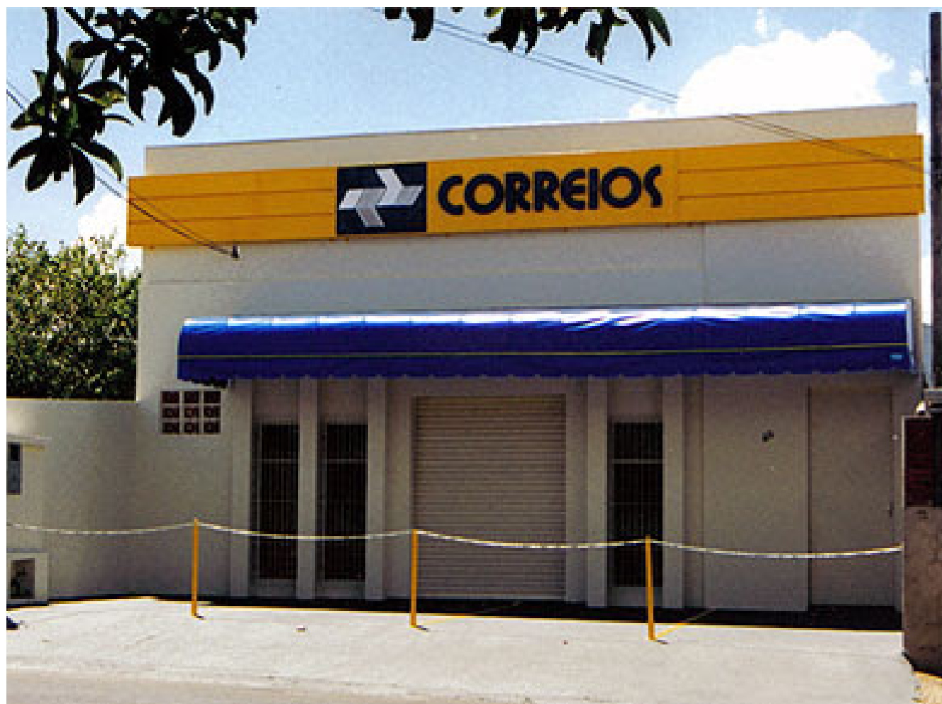
Imagem mostra agência dos Correios

Estatual prevê modernizar atendimentos e até criar contas digitais para atrair clientes