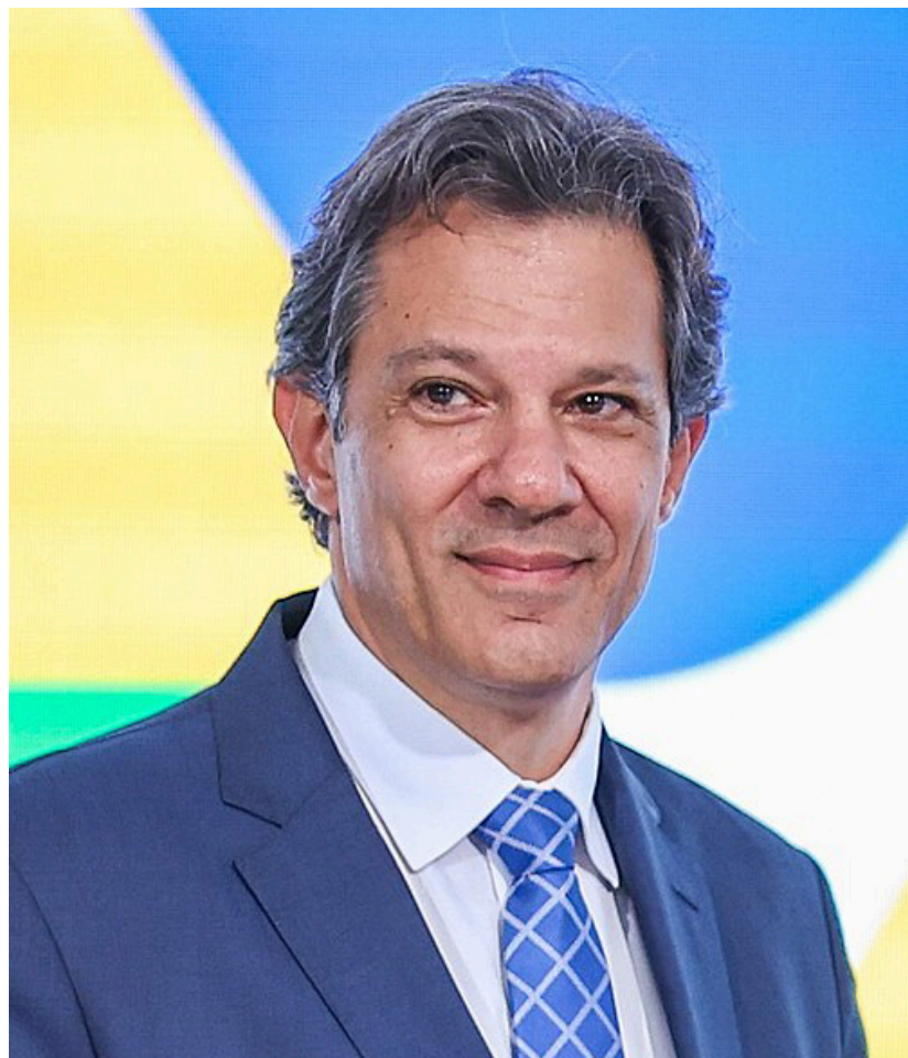
Imagem mostra Ministro Fernando Haddad