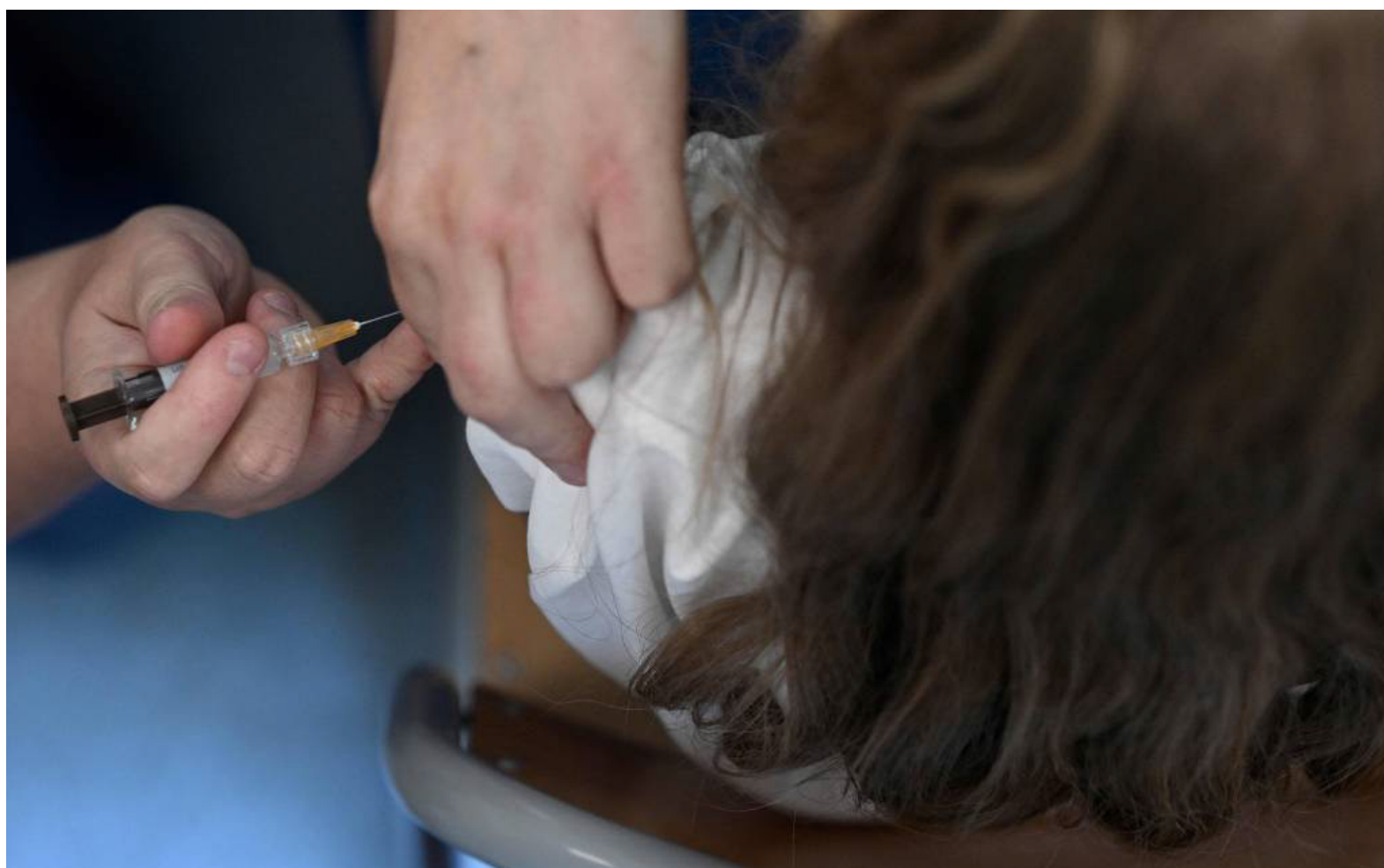
Menina recebe dose de vacina contra o HPV