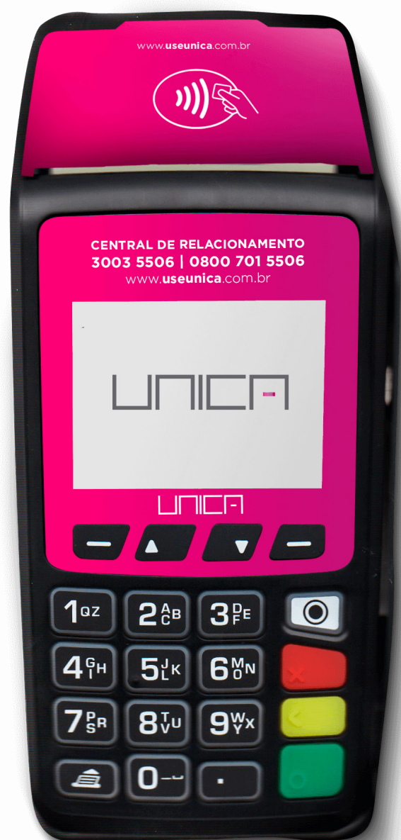
Imagem mostra máquina de cartão com sistema NFC

Criminosos digitais se aprimoram a cada dia mais para ataques sofisticados contra sistemas digitais.