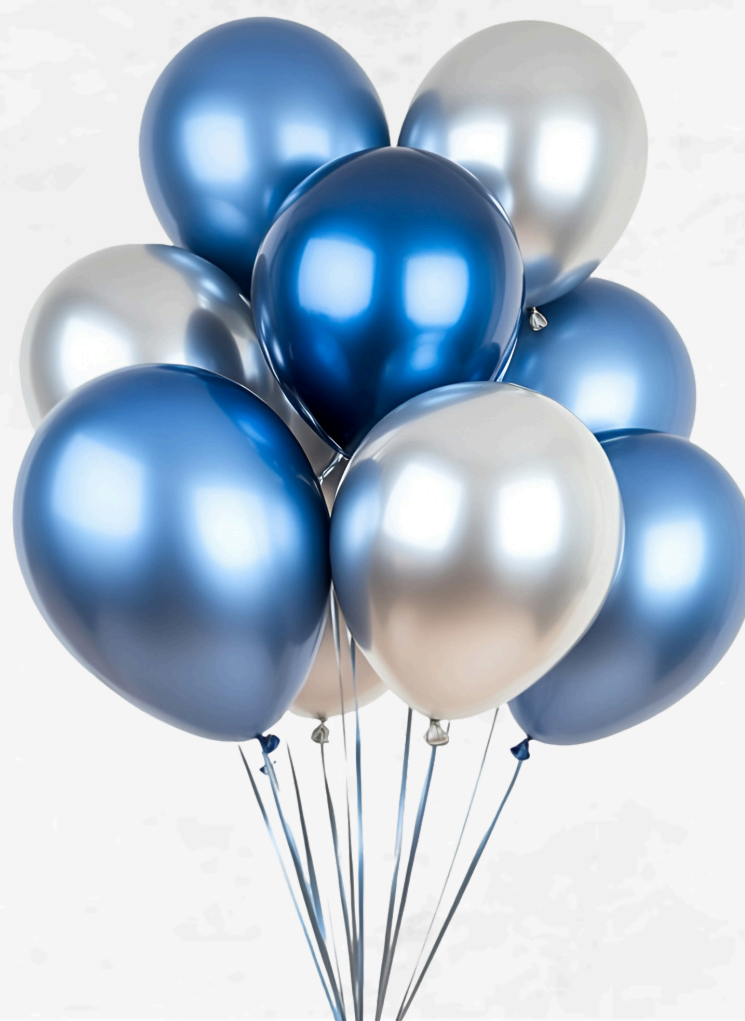
Imagem comemorativa celebra os 2 anos da agência Orcon Press