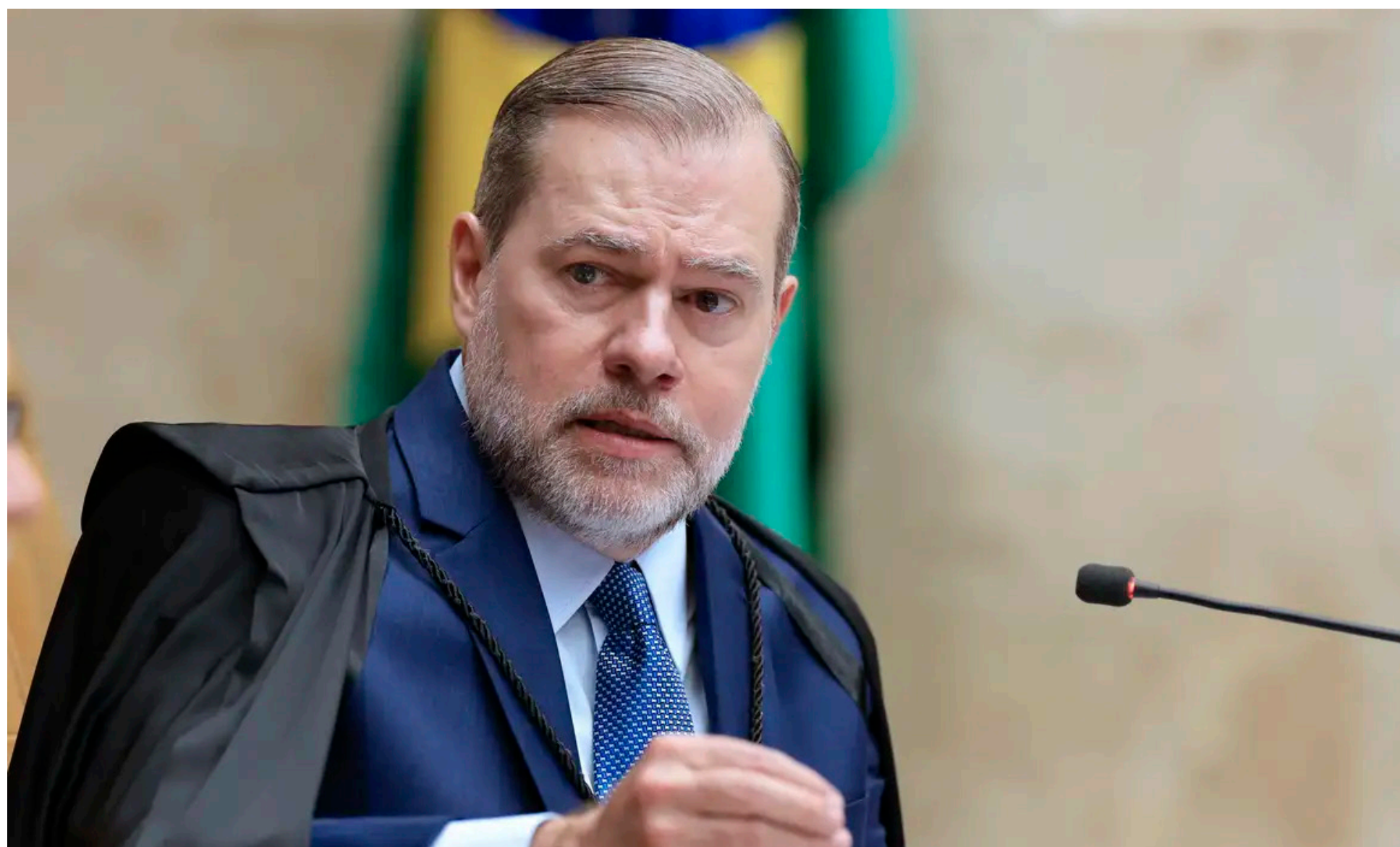
Ministro Dias Toffoli discursa em Plenário do STF