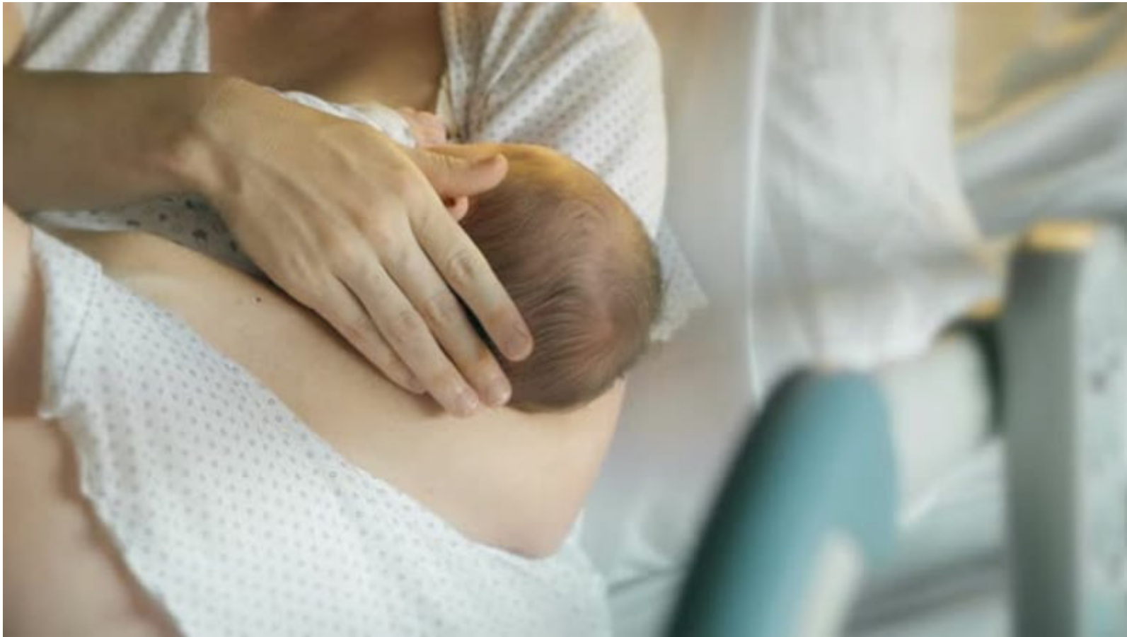
Imagem mostra representação de uma mulher que segura seu bebê recém-nascido nos braços

O Ministério da Saúde disponibilizou o curso de consulta da criança e da mulher/pessoa no puerpério na primeira semana de vida na Atenção Primária à Saúde. A iniciativa busca fortalecer o cuidado integral e qualificado desde os primeiros dias de vida do bebê, etapa fundamental para a saúde da criança, da mulher no puerpério e de suas famílias. A formação é voltada a gestores e profissionais de saúde.