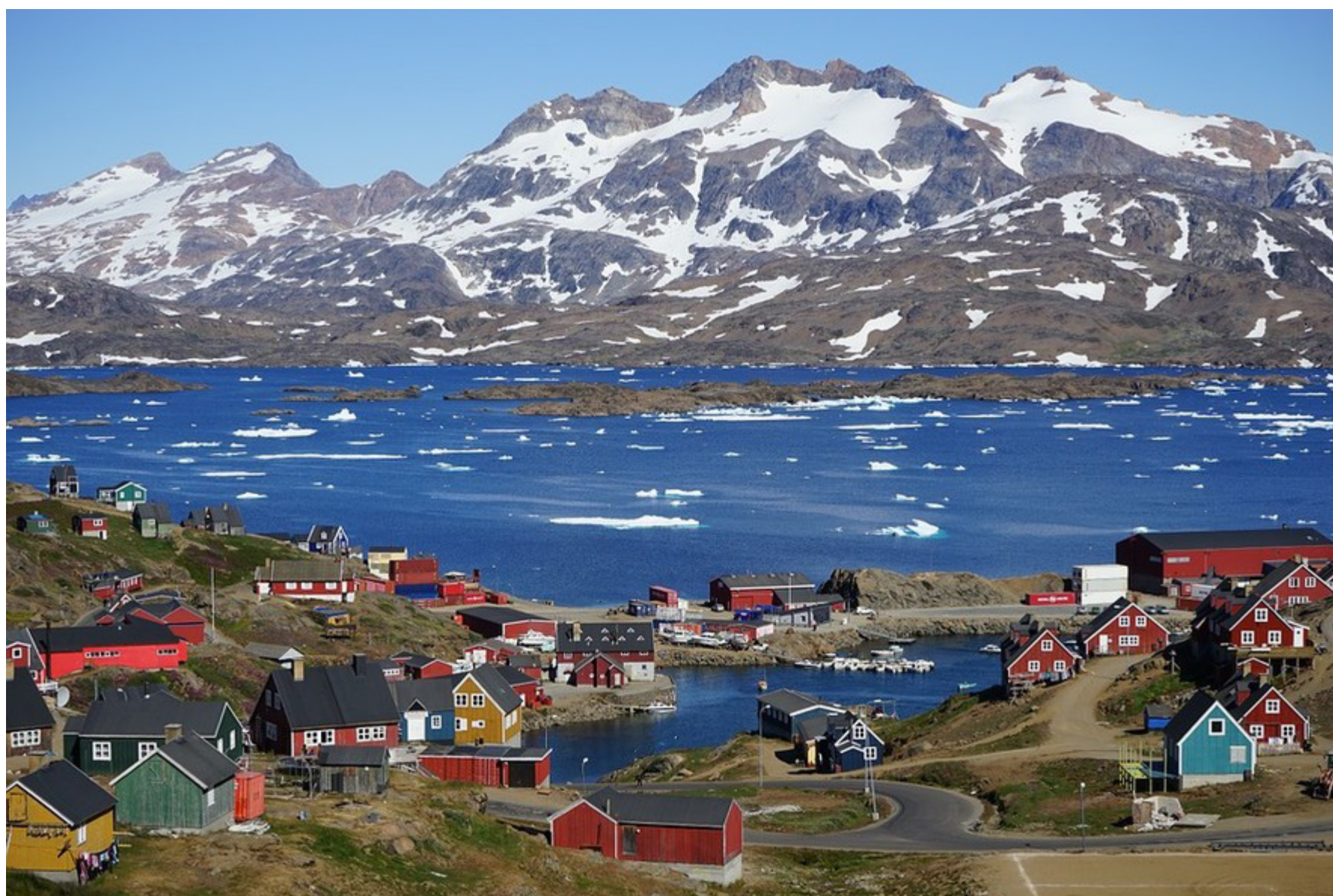
Imagem mostra Groenlândia, território cobiçado por Donald Trump

Os Estados Unidos se reuniram com Dinamarca e Groenlândia na terça-feira, 13, para tentar resolver o impasse gerado por Donald Trump, Presidente norte-americano, que quer anexar as ilhas do ártico a seu território.