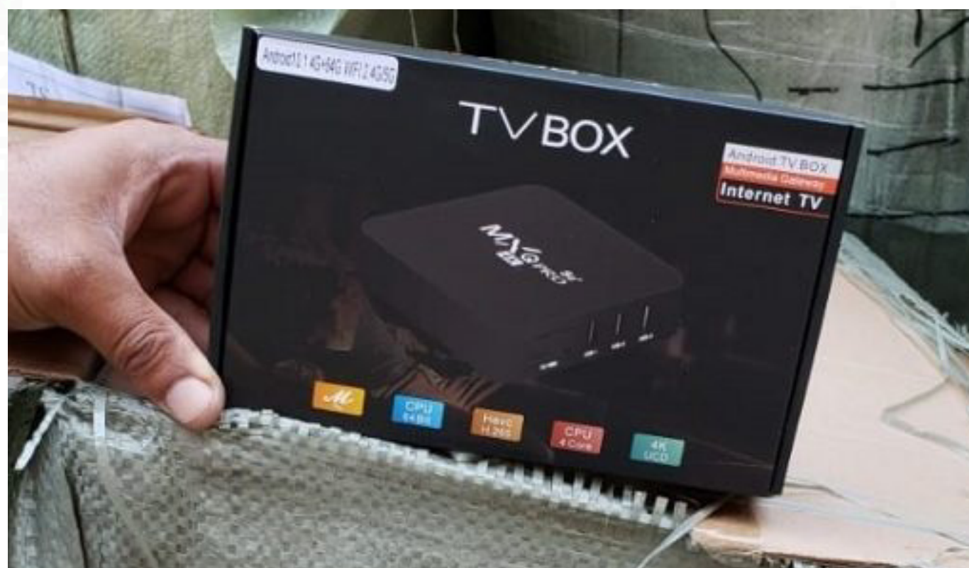
Imagem mostra aparelho de TV Box pirata