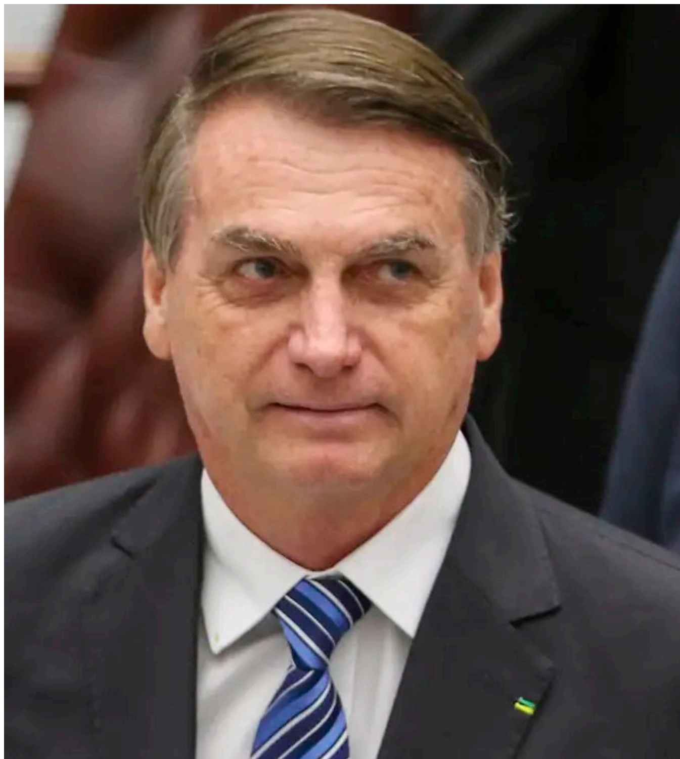
Imagem mostra ex-presidente Jair Bolsonaro