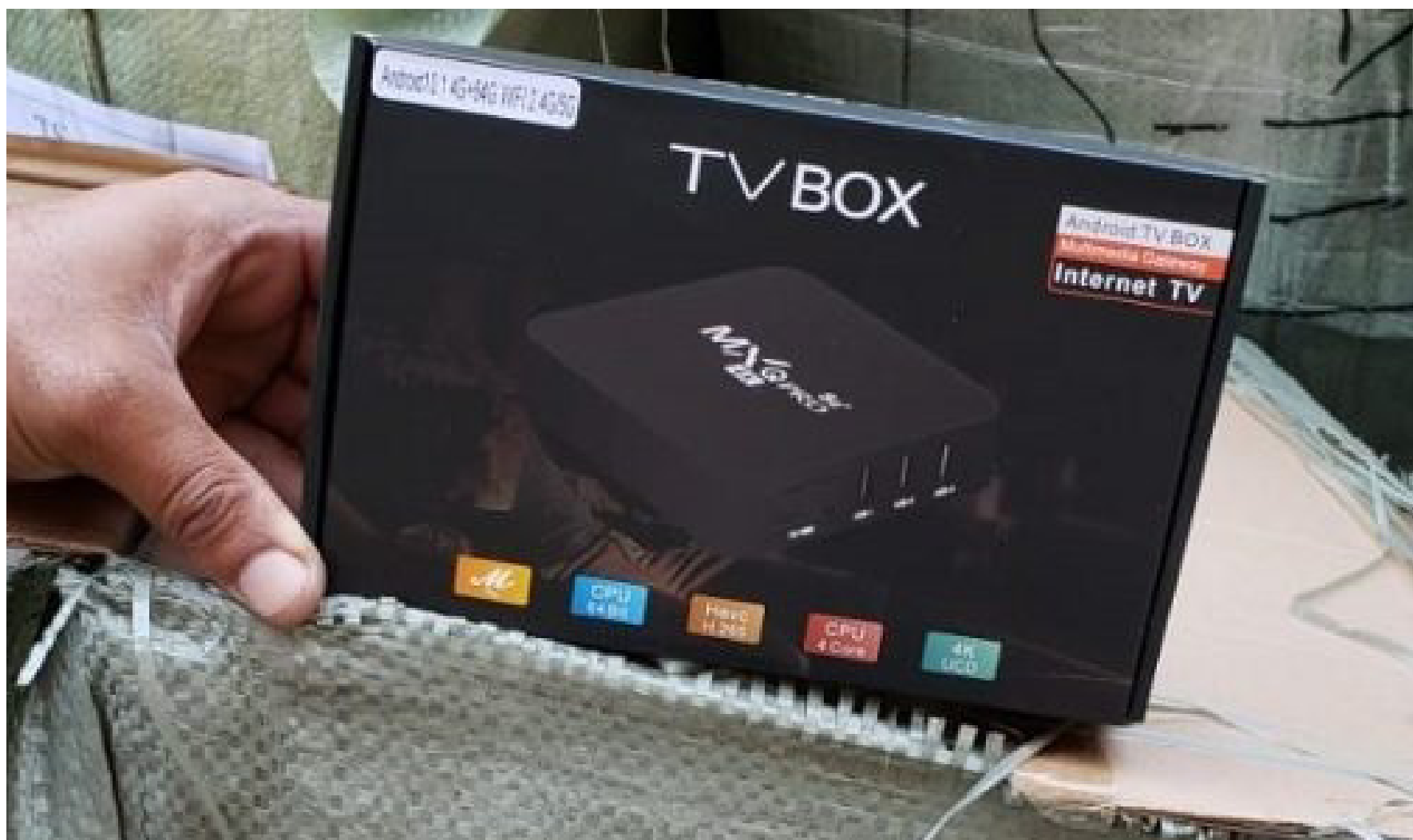
Imagem mostra aparelho de TV Box pirata